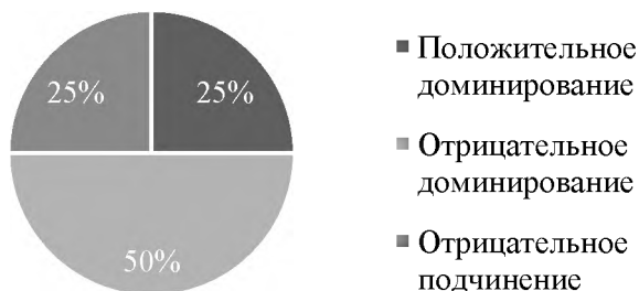
Рис.2. Частота проявлений форм личностного поведения среди мальчиков

Данные рисунка 2 говорят о том, что 4 мальчика (50 %) в конфликте взаимодействуют со сверстниками через отрицательное доминирование, 2 мальчика (25 %), выбирают положительное доминирование, ещё 2 (25 %) – отношение отрицательного подчинения: уступают, слушаются, терпят, переживают.