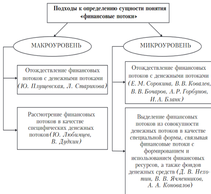
Рисунок 1 – Подходы к определению сущности понятия «финансовые потоки»