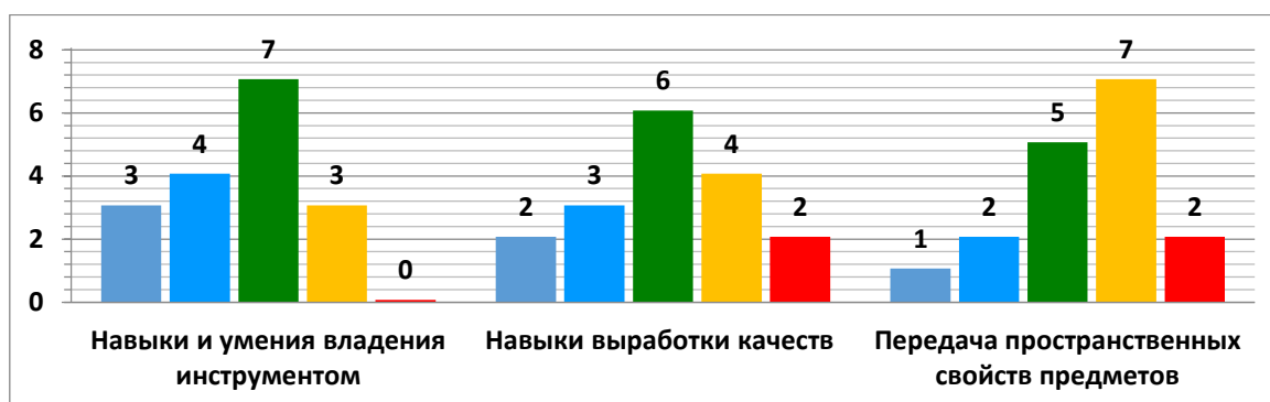
Рис. 1. Результаты констатирующего этапа исследования

Констатирующий этап показал, что только у одного ребенка все три навыка имеют высокий уровень, и один ученик имеет низкий уровень навыка выработки качеств и с трудом передает пространственные свойства предметов.