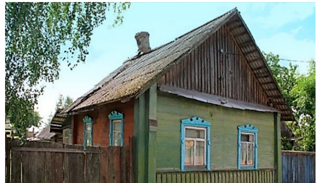
Дом, где до семи лет жил Е.Ф. Ивановский

Родился наш славный земляк 7 марта 1918 года в селе Черя недалеко от районного центра Чашники Витебской области. Именно это местечко стало малой родиной будущего генерала. В деревне и сейчас стоит дом Ивановских, где до семи лет жил маленький Женя.