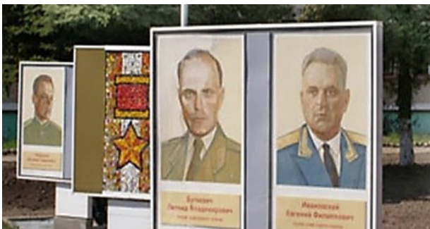
Портрет Е.Ф. Ивановского размещен на Аллее Героев в Чашниках