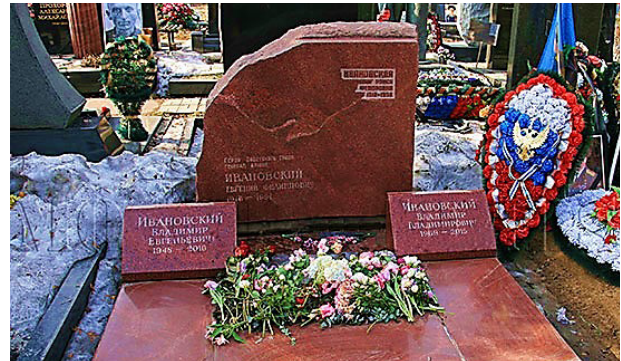
Могила генерала Е.Ф. Ивановского на Новодевичьем кладбище в Москве

Умер Евгений Филиппович 22 ноября 1991-го и был похоронен в Москве.