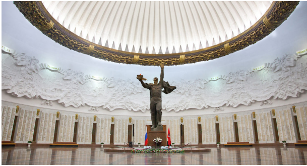
Зал славы музея Великой Отечественной войны. Новодевичье кладбище

1 сентября 2020 года в городе Витебске состоялось торжественное открытие нового учреждения образования – средней школы № 47 имени Евгения Филипповича Ивановского.