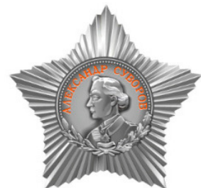
Орден Суворова III степени