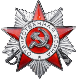
Орден Отечественной войны II степени