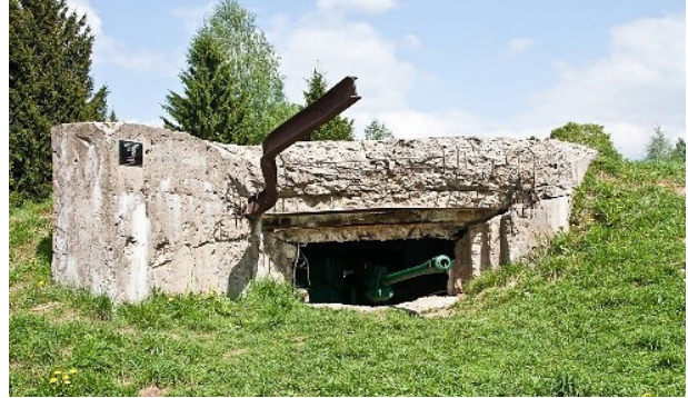
Можайская линия обороны

Когда он был отправлен на фронт, положение там было тяжелейшим: ни днем, ни ночью бои не прекращались. Будущий Герой Советского Союза – активный участник военных действий. Он сражался с фашистами во время обороны и контрнаступления советских войск в битве за Москву.