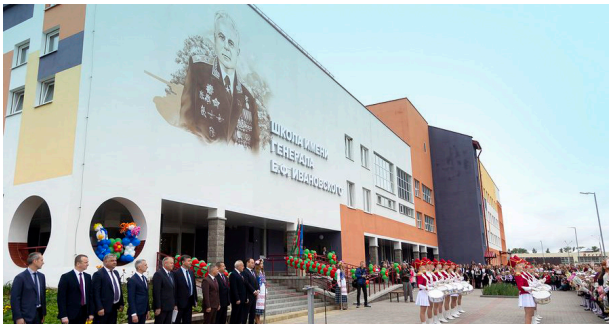
ГУО «Средняя школа № 47 г. Витебска»

1 сентября 2020 года в городе Витебске состоялось торжественное открытие нового учреждения образования – средней школы № 47 имени Евгения Филипповича Ивановского.