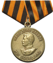
Медаль «За победу над Германией в Великой Отечественной войне 1941-1945 гг.»