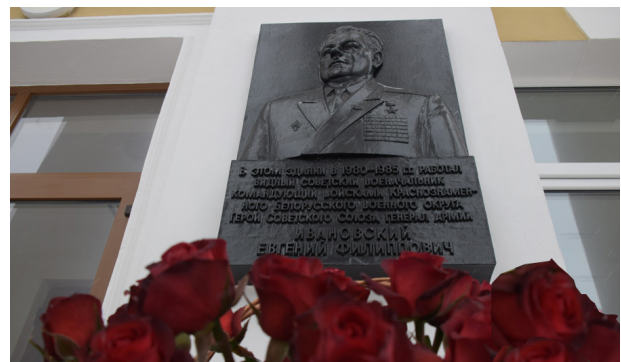
Мемориальная доска на здании штаба и управления Министерства обороны в Минске