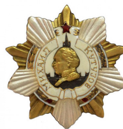
Орден Кутузова I степени