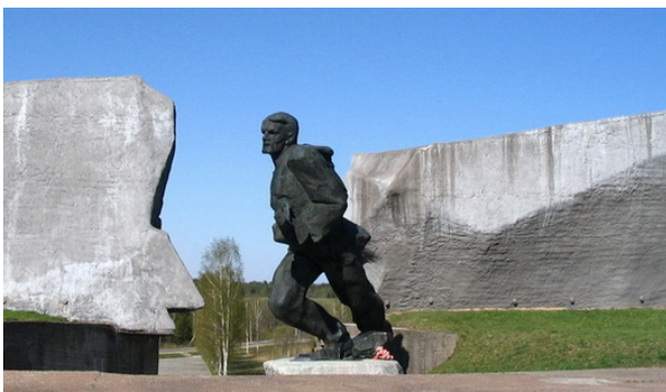
Мемориальный комплекс «Прорыв» в Ушачах