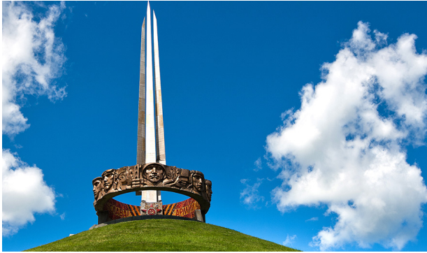
Мемориальный комплекс «Курган Славы» под Минском