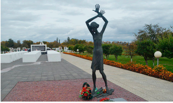
Мемориальный комплекс в поселке Красный Берег, посвященный детям – жертвам войны