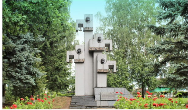
Памятник погибшим детям Батки Миная в Сураже