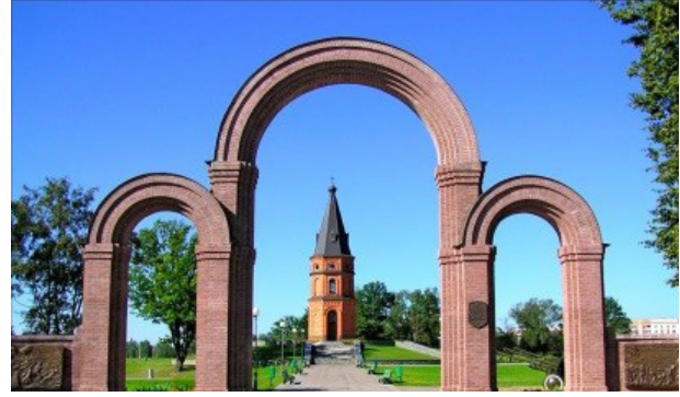
Мемориальный комплекс «Буйничское поле» в Могилёве