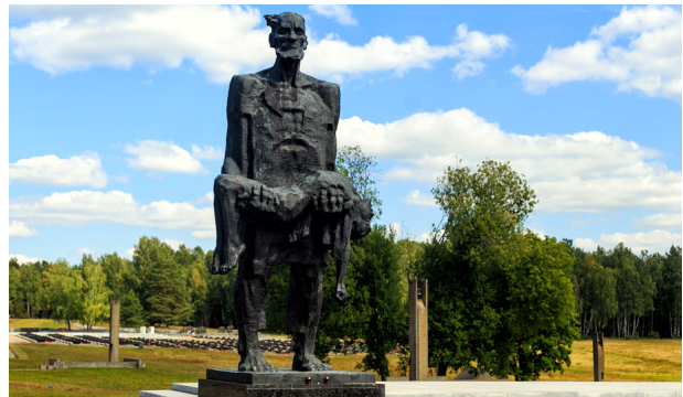
Мемориальный комплекс «Хатынь» под Минском