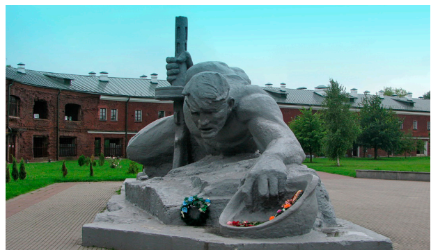
Мемориальный комплекс «Жажда» в Бресте