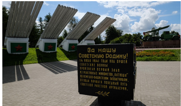
Мемориальный комплекс «Катюша» в Орше