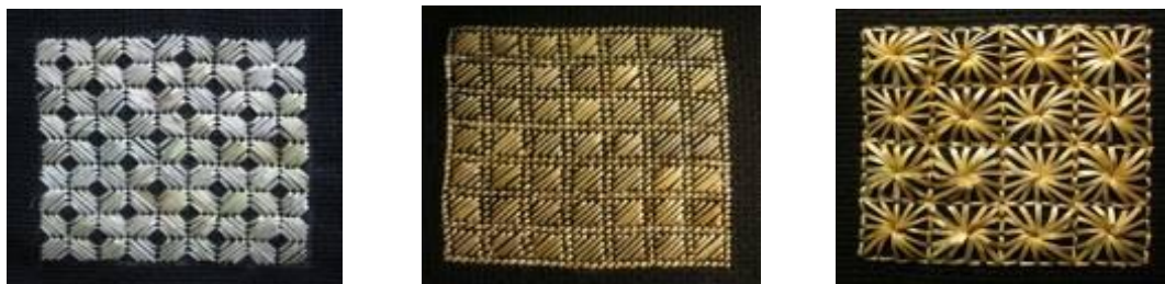
Рисунок 1. – Образцы вышивки соломкой

Соломка – традиционный природный материал Беларуси, настоящее крестьянское золото, которым природа щедро одарила нас. Он экологически чистый, и его использование не принесет вреда здоровью учащихся и студентам, а работы из соломки, казалось бы, из грубого материала, получаются красивые, эффектные, отличаются оригинальностью, изысканностью и особым теплом.