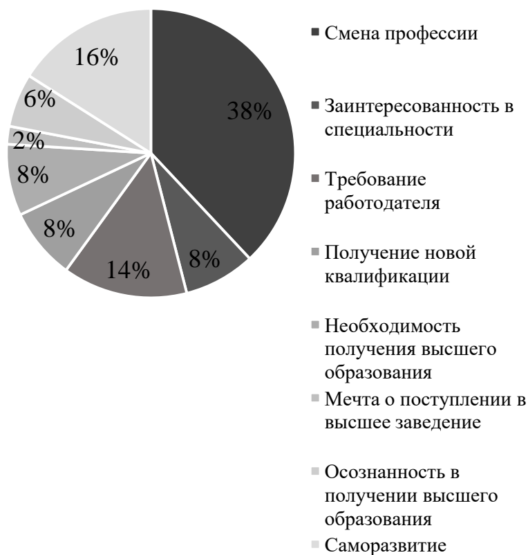
Рисунок 1 – Причины получения образования во взрослом возрасте

что комфорта не испытывают, возможно, причиной является определенный временной разрыв между предыдущим и настоящим обучением;