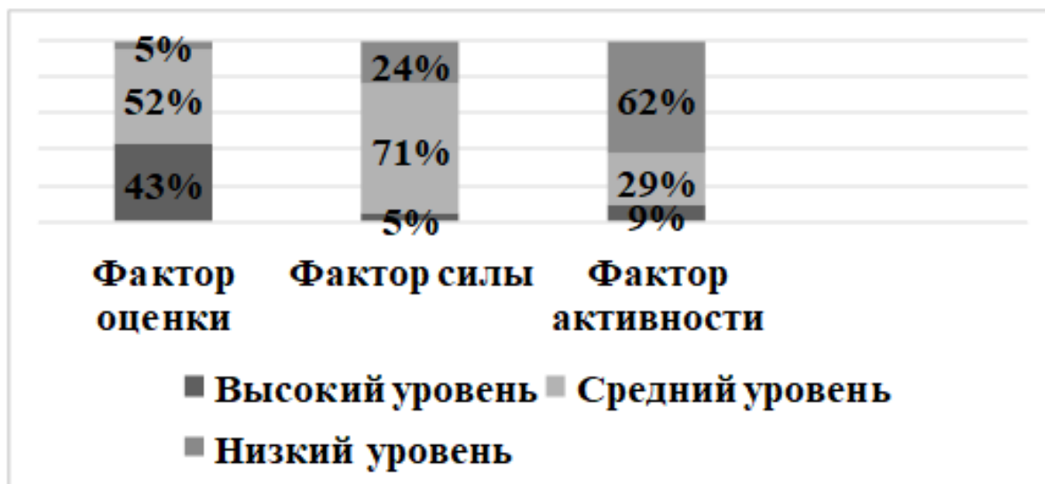
Рисунок 1 – Показатели самооценки имиджа педагогами

Результаты и их обсуждение. Количественные результаты (в процентах) по самооценке собственного имиджа педагога представлены на рисунке 1.