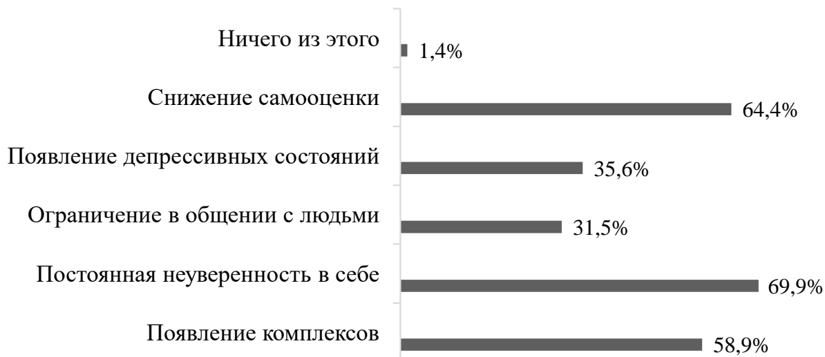
Рисунок 3 – Проявления психологического дискомфорта при Акне

Заключение. Таким образом, Акне достаточно актуальная проблема, с которой сталкиваются люди разного возраста. Акне влияет на психологическое состояние, самооценку человека. С целью повышения самооценки, принятия себя, адекватного самоотношения была разработана программа, ориентированная на лиц подросткового возраста, которая может быть использована в практической деятельности педагогов-психологов.