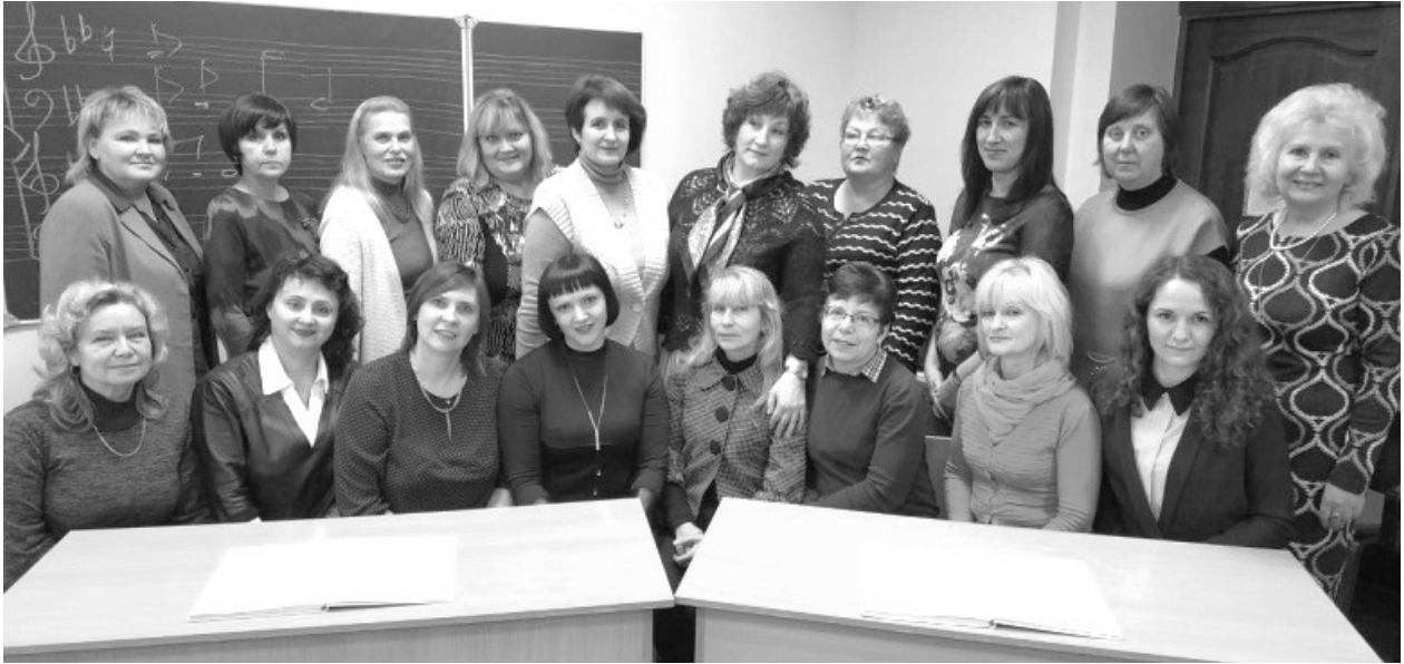
Состав комиссии основного и дополнительного музыкального инструмента (фортепиано)

комиссий в колледже. В ее состав вошли 18 преподавателей и концертмейстеров: