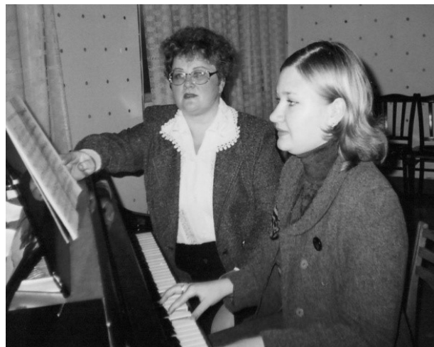
Дуэт преподавателей и учащихся