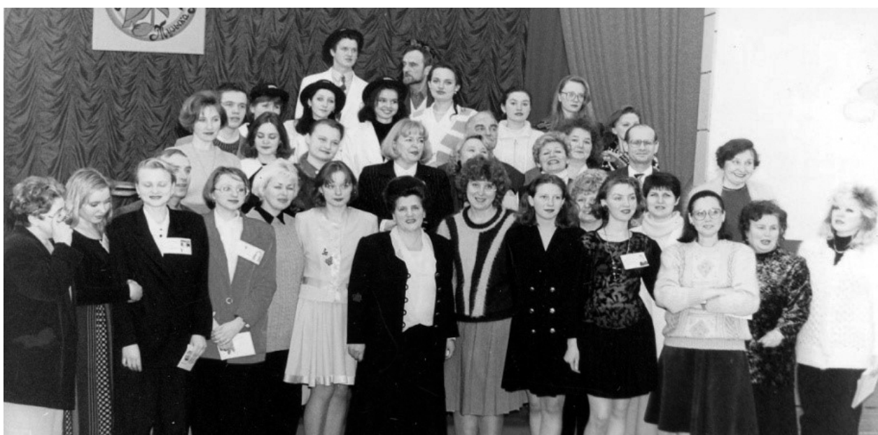
Участники республиканских конкурсов педагогического мастерств