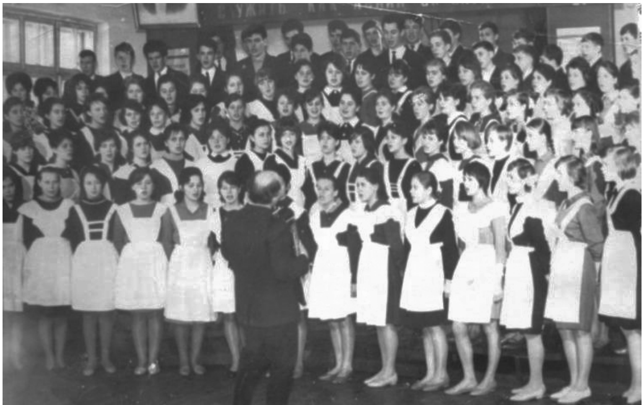
Хоровой коллектив, 1968

Занятия музыкой с преподаванием методики музыкального воспитания многие годы были и до сих пор остаются частью учебных планов по подготовке учителей начальных школы. А вот индивидуальные занятия по освоению приемов и навыков игры на музыкальном инструменте стали доступны только с введением дисциплины