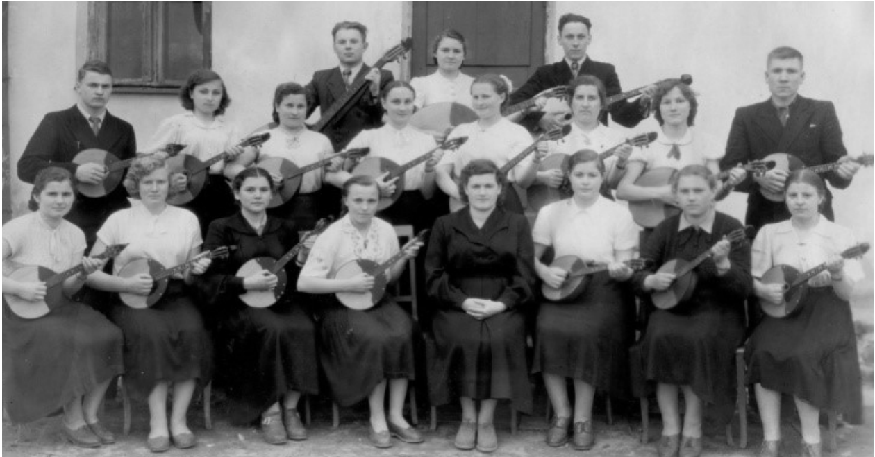
Оркестр народных музыкальных инструментов Полоцкого педучилища имени Франциска Скорины, 1957