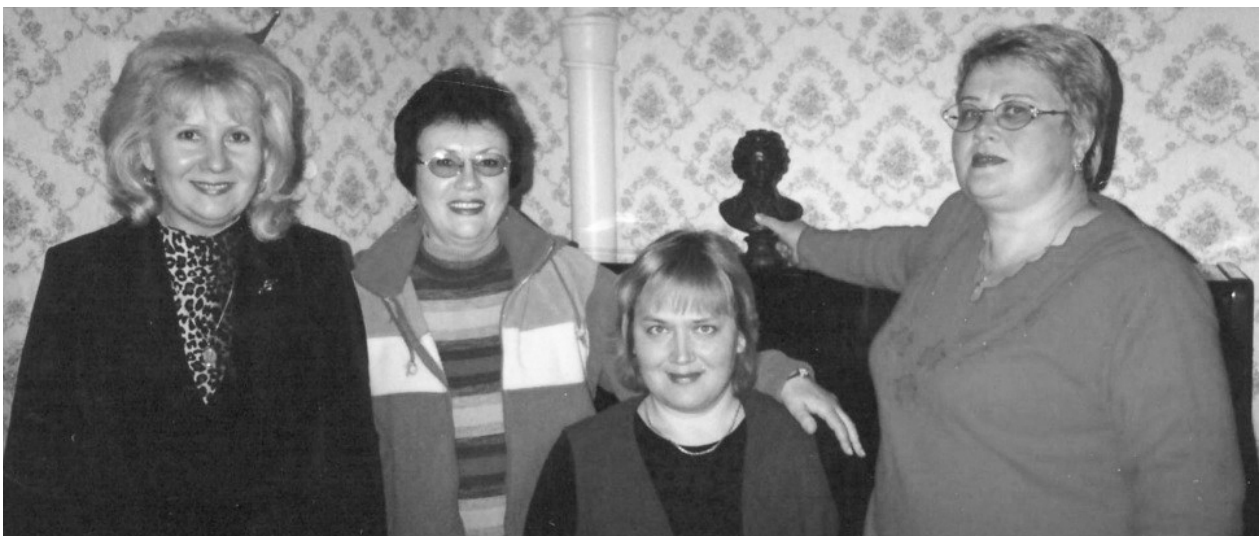
Состав комиссии основного музыкального инструмента (фортепиано)

В начале 2000-х годов в состав комиссии основного музыкального инструмента (фортепиано) входили преподаватели: