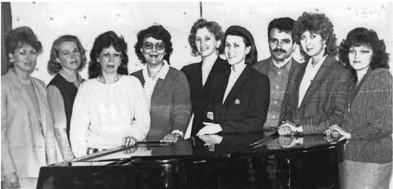
Преподаватели П(Ц)К основного музыкального инструмента (фортепиано), 1990-е годы