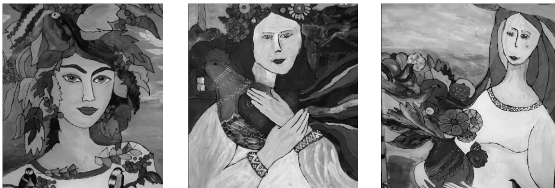
Рисунок 2 – Проект «Белорусочки»

Приобщение к национальной культуре осуществляется через создание работ, отображающих народные праздники, обряды, традиции, игры. Это способствует воспитанию духовно-нравственных качеств личности, формированию чувства гордости за свою национальную принадлежность, устойчивого интереса к истории своего народа, формированию художественного вкуса, фантазии, инициативы, самостоятельности.