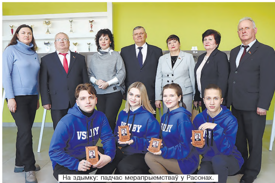
На здымку: падчас мерапрыемстваў у Расонах.

Я ўпэўнены, што маладому пакаленню трэба ўдзельнічаць у падобных мерапрыемствах, бо кожны чалавек павінен адчу-