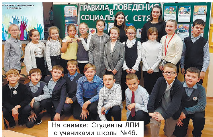
На снимке: Студенты ЛПИ с учениками школы №46.