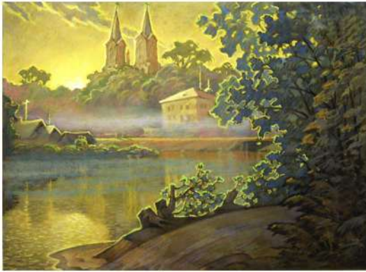
В. Шамшур. Мёры. Пастэль. 2008