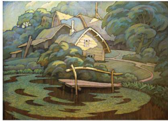
В. Шамшур. Хутар Альбіна. Серыя «Лазні». Кардон, пастэль. 2002