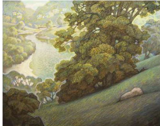
В. Шамшур. Лучоса. З серыі «Прыдзвінне». Кардон, пастэль. 2008