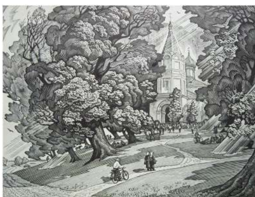
В. Шамшур. Фэст у Чэрасах. Лінарыт. 1990