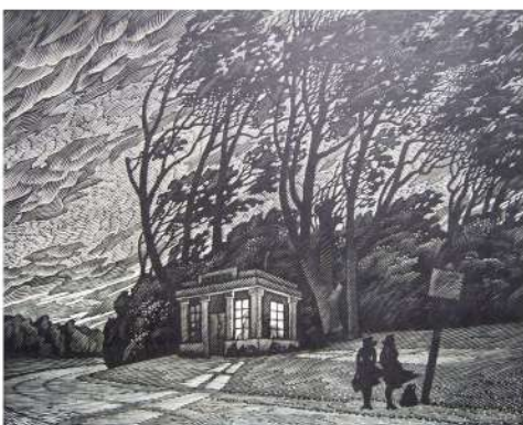
В. Шамшур. Апошні аўтобус. Лінарыт. 1987