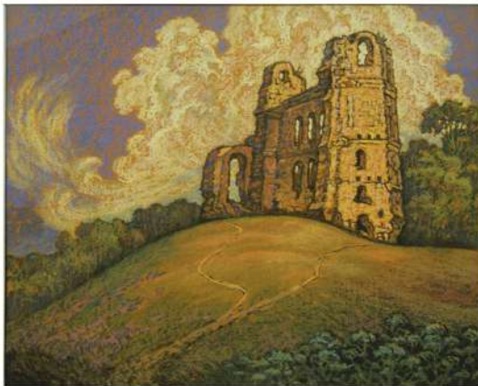
В. Шамшур. Веліч мінулага (Белы Ковель). Кардон, пастэль. 2008