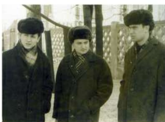
Зіма. З аднакурснікамі