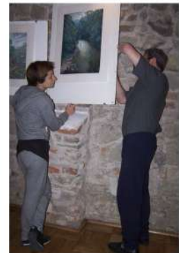
Падрыхтоўка экспазіцыі ў г. Горліцы, Польшча