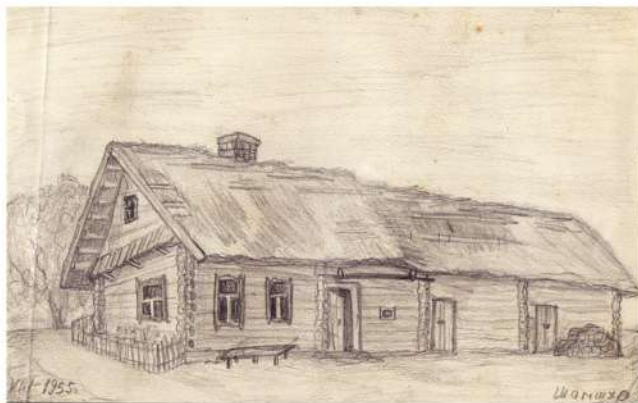
В. Шамшур. Малюнак бацькавай хаты ў в. Пціцкія. 1955