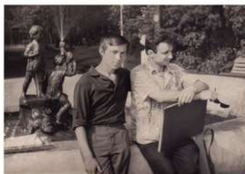
На замалёўках у парку