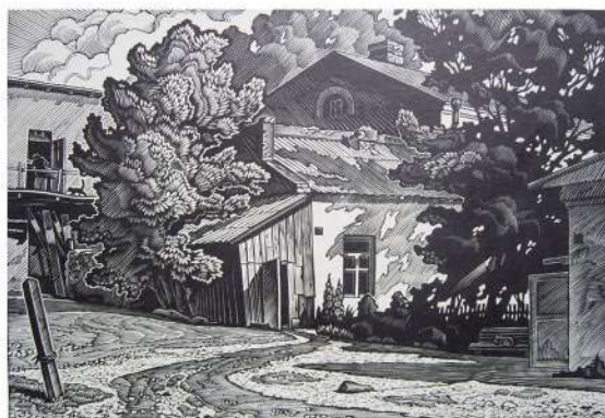
В. Шамшур. Віцебскі дварок. Лінарыт. 1986