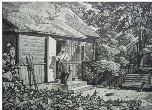
В. Шамшур. Чайкі. Лінарыт. 1988