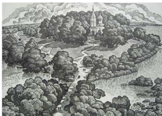
В. Шамшур. Мой азёрны край. Лінарыт. 1988