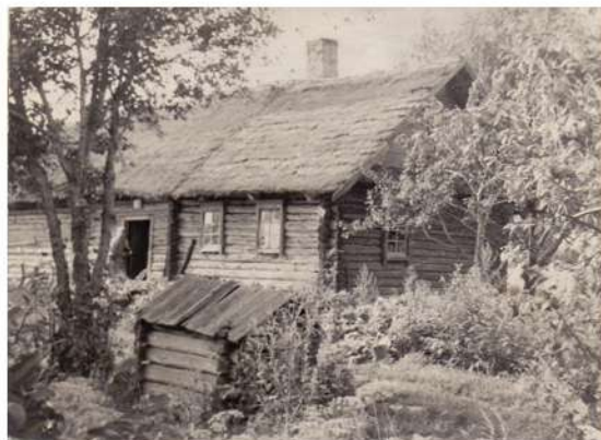
Матчына хата ў в. Масеўцы