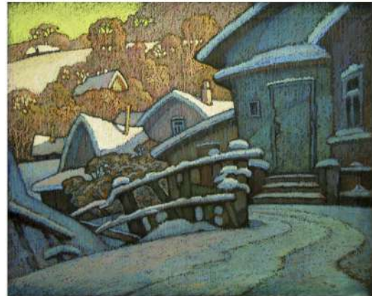
В. Шамшур. Украіна вёскі. Серыя «Лазні». Кардон, пастэль. 2011