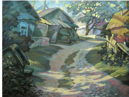
В. Шамшур. Вечар у Бычках. Кардон, пастэль. 2007