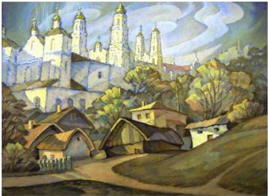
В. Шамшур. Глыбокае. Кардон, пастэль. 2007