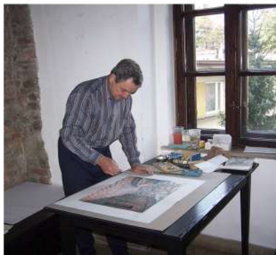
Міжнародны пленэр. У майстэрні. Польшча