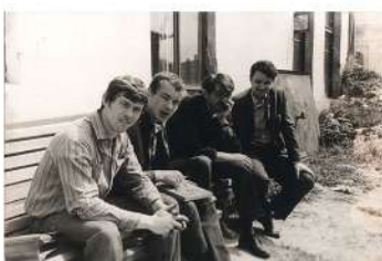
Чэрвень. З аднакурснікамі