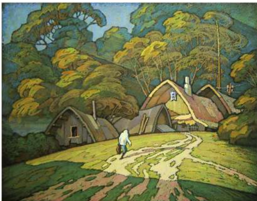
В. Шамшур. Вяртанне. Серыя «Лазні». Кардон, пастэль. 2011