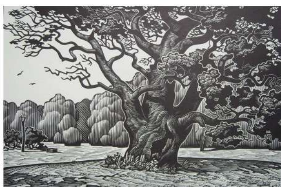
В. Шамшур. Лясны ветэран. Лінарыт. 1988