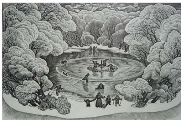
В. Шамшур. Забавы дзяцінства. Калаўрот. Лінарыт. 1987