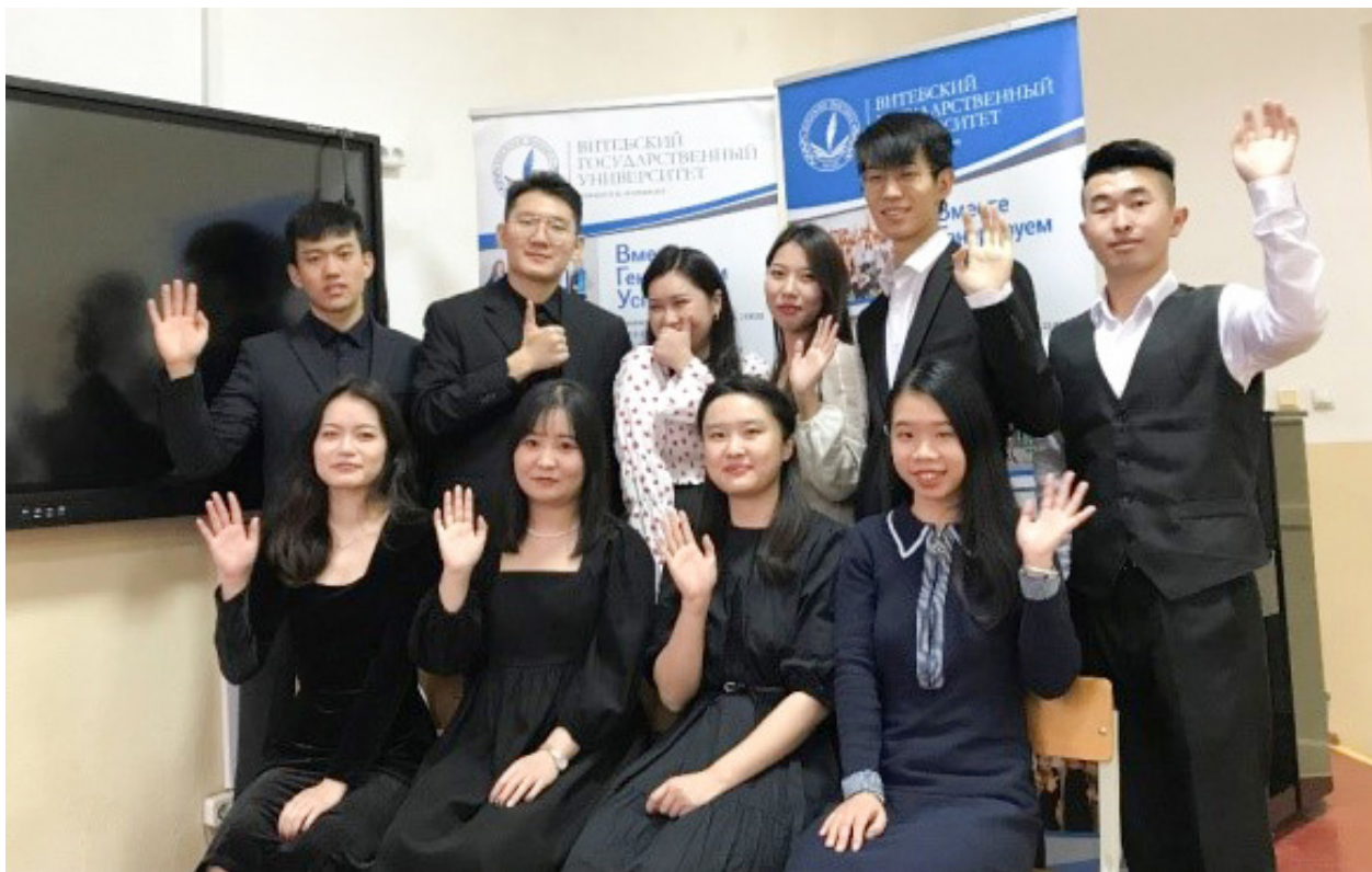
Рисунок 1 – Участники проекта «Путешествие в Китай»

Педагогическая практика иностранных студентов на 4-м курсе проходит в несколько этапов (таблица).