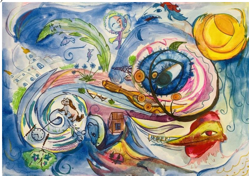
Рис. 3 – Карпова Ксения. По мотивам шагала

Практическое задание 3. Выполнение ассоциативной композиции с использованием цветовых сочетаний, характерных работам М. Шагала (Рисунок 3).