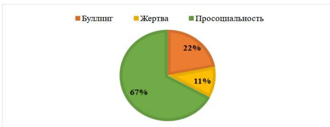
Рисунок 1 – Результаты исследования по методике «Отношения со сверстниками»

Результаты и обсуждение. Результаты исследования посредством методики «Отношения со сверстниками» представлены на рисунке 1.