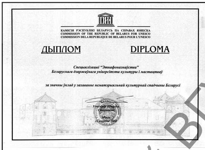
Мал. 2. Дыплом за захаванне НКС, якім узнагароджана спецыялізацыя «Этнафоназнаўства». 2008 г.

Трэцяя спроба ладзіцца зараз па матэрыялах экспедыцый супрацоўнікаў і навучэнцаў БДУКіМ на Полацкае купалле, наладжаных пры дапамозе вядомай даследчыцы-палевіка, журналісткі Рэгіны Гамзовіч.