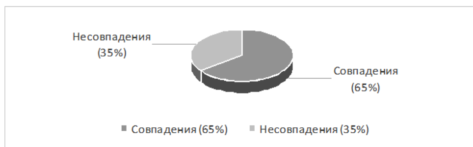
Рисунок 1 – Распределение ответов на вопрос «Совпадает ли Ваш любимый предмет в школе с тем, который Вы преподаете сейчас?»

В.А. Сухомлинский сказал: «Если нормальный человек ни в одном предмете не достиг успехов, если у него нет любимого предмета, значит, школа не настоящая».