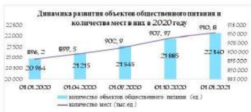
Рисунок 1 – Динамика развития объектов общественного питания и количества мест в них в 2020 году.

Нами проведен анализ товарооборота общественного питания по областям и г. Минску за 2016–2020 гг. Исходные данные приведены в таблице.