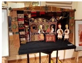
Рисунок 3 – Эскизы и макет к спектаклю “Ох і залатая табакерка”

Заключение. Проанализировав некоторые решения оформления сцены участников и победителей республиканского конкурса на премию И.М. Ушакова, можно сделать вывод, что творчество художников-сценографов в театрах Беларуси, является фактором создания новых, экспериментальных форм высокохудожественной сценографии. Конкурс на премию И.М. Ушакова, продолжает выявлять преемственность особенностей творчества в театральном искусстве, способствовать росту профессионального мастерства и пополнению сокровищницы сценографического искусства новыми творческими активами.