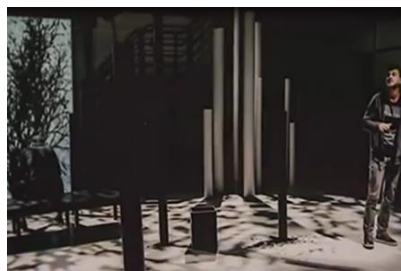
Рисунок 2 – Макет и эскизы к спектаклю “Запалкі”

Также жюри отметило и региональные театры, дипломом БФК награждена художник-постановщик Д. Дубовик Витебского белорусского театра “Лялька” за сценографию к спектаклю “Мой надзейны сябар: 101”.