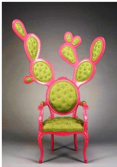
Рисунок 1 – «Колючая пара» Valentina Gonzalez

2. Объект, как продукт творческого процесса, созданного автором, уникальный и неповторимый, смысл, воплощенный в материале (рисунок 3).