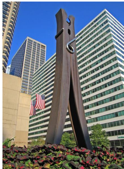
Рисунок 2 – К. Ольденбург «Прищепка», 1979