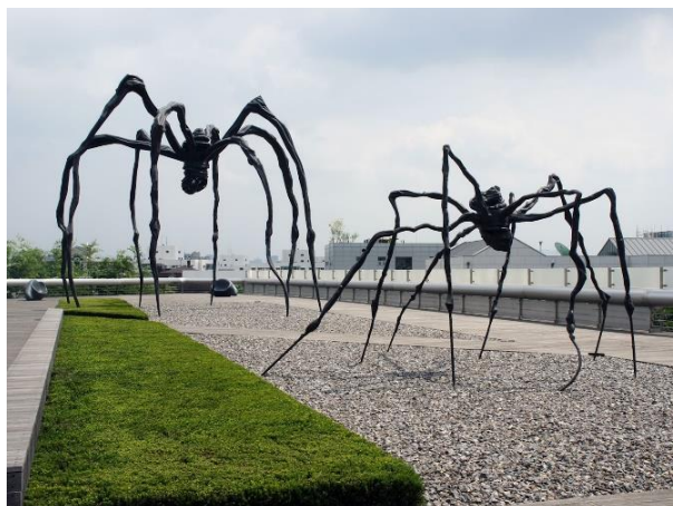
Рисунок 3 – Луиз Буржуа. «Паучихи»

Пластические, цветовые, фактурно-текстурные составляющие арт-объекта определяют его местоположение в среде, зависят от общего стилистического решения интерьерной или экстерьерной среды, формируют системно – целостное ее восприятие.