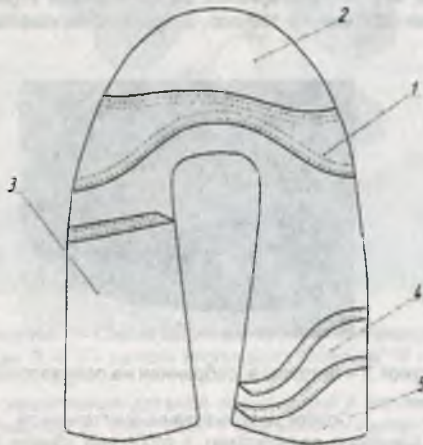
Рисунок 1 – Схема заготовки верха туфель дошкольных

Проектирование пазов, вырезов и контура, подготовка управляющих программ к полуавтомату ПШ-1 выполнены с помощью системы автоматизированного проектирования и изготовления оснастки и подготовки управляющих программ к швейному полуавтомату (САПРИО и ПУП) [2].