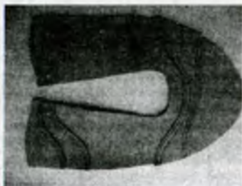
Рисунок 3 – Заготовка, собранная на полуавтомате ПШ-1

Результаты замеров затрат времени на выполнение операции сборки заготовок верха обуви сравнивались с данными технологического маршрута сборки изделия на ОАО "Обувь". Установлено, что затраты времени на выполнение строчки при существующей технологии составляют 937 мин на 100 пар, а при автоматизированной – 350 мин, что в 2,7 раза меньше.