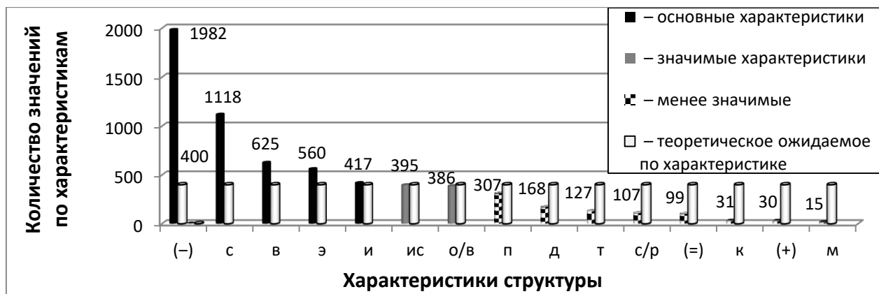
Рисунок 2. – Рейтинговое распределение структурно-содержательных характеристик Ты-образа безответственного руководителя у субъектов управления

400 значениям, но чуть менее, чем у основных характеристик, поэтому отнесены к значимым.