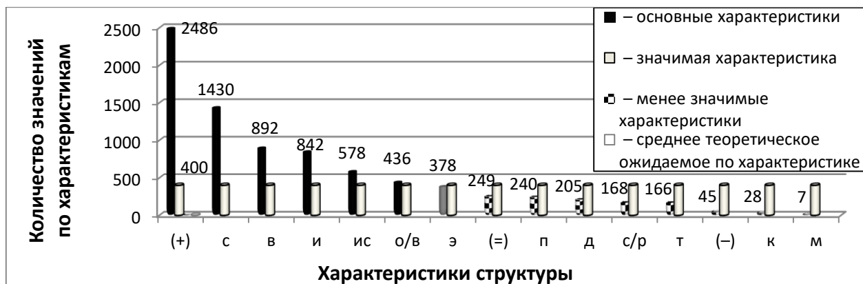
Рисунок 1. – Рейтинговое распределение структурно-содержательных характеристик Ты-образа ответственного руководителя у субъектов управления

Для установления основных структурно-содержательных характеристик образа руководителя осуществлены расчеты эмпирической оценки каждой характеристики, определены вес и коэффициент значимости. В разделе 2.2 показан результат по установлению основных характеристик Ты-образа ответственного руководителя согласно их рейтингу (рисунок 1).