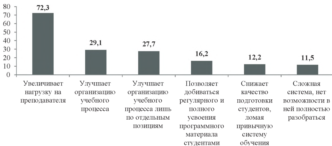
Рис. 2. Отношение преподавателей к балльно-рейтинговой системе

Несмотря на уже имеющийся опыт работы с балльно-рейтинговой системой, в целом опрошенные оценивают ее неоднозначно. Многие считают, что она увеличивает нагрузку на преподавателя. Вместе с тем почти треть оценивает опыт использования системы как положительный, позволяющий изменить организацию учебного процесса в лучшую сторону, а 16,2 % считает, что данная система позволяет студентам лучше усваивать изученный материал. Значит, высокая нагрузка могла бы быть оправданной при достойной оплате [3].