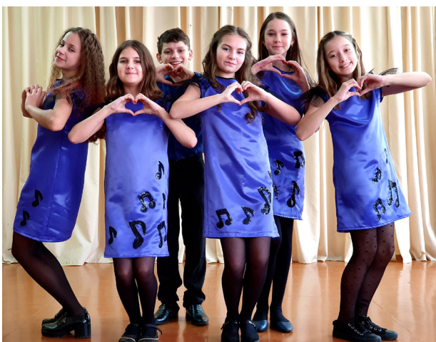
Рисунок 6 – МультиБум