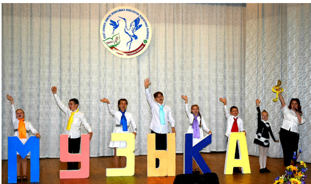
Рисунок 4 – Учитель года Республики Беларусь