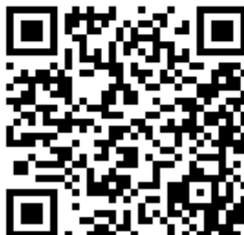
Рисунок 2 – YouTube-канал