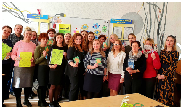
Рисунок 5 – Мастер-класс для учителей музыки