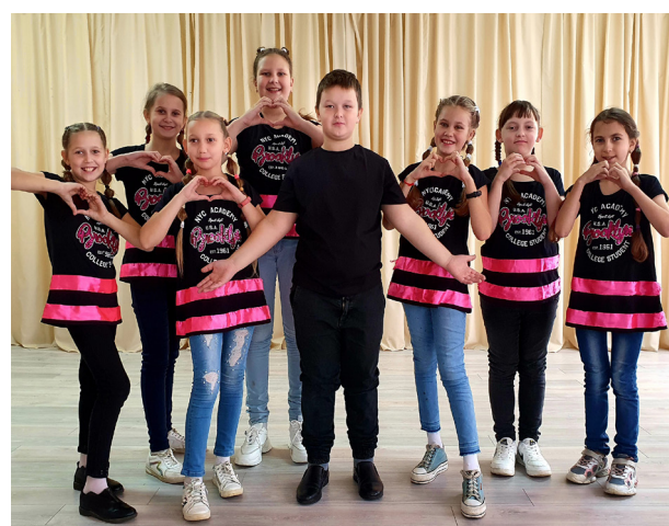
Рисунок 7 – Вокальный ансамбль «Неподарочки»

Размышляя над тем, как много всего было сделано, я прихожу к мысли о том, что быть учителем – мое истинное предназначение. Создала бы я свой блог или канал, если бы не горела школой и работой с детьми? Нет. Искала бы новые формы работы, технологии, приемы, «фишечки»? Не знаю. Все то, что я демонстрировала на конкурсе «Учитель года Республики Беларусь – 2020» (рисунок 4) и на других конкурсах педагогического мастерства (рисунок 5), было создано не для конкурсов и не ради «лайков» в Интернете. Все было создано для моих учеников, для коллег, для школы, для повышения моего мастерства.