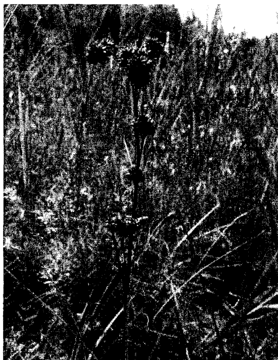
Рис. 1. Cladium mariscus (L.) Pohl: соцветие в фазу плодоношения (побережье оз. Бродонок).

(1 кв.м) достигает 100%. Единичные особи отмечены у береговой линии на удалении от основного фрагмента на расстоянии 50 м. Следует отметить, что более по береговой линии растения C. mariscus не выявлены. Жизненное состояние популяции оценивается как «хорошее» (балл 4 из 5).