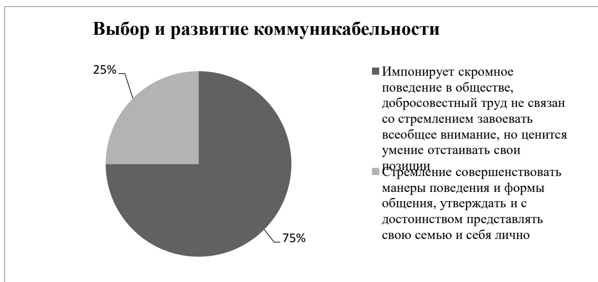
Рисунок 5 – Взгляд респондентов на развитие коммуникабельности

Данные показатели свидетельствуют о том, что треть участников анкетирования сделали свой выбор по отношению к положительному развитию коммуникабельности в обществе, но без стремления совершенствоваться в своём саморазвитии.