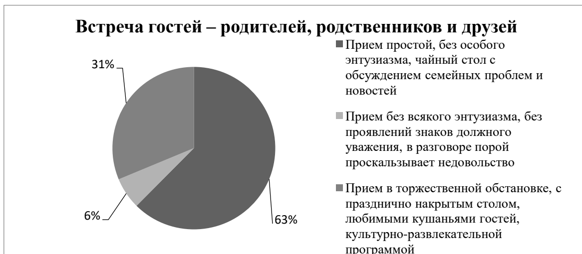
Рисунок 1 – Отношение респондентов о встрече гостей

Данные, представленные на рисунке 1, свидетельствуют, что 94% опрошенных в отношении гостей настроены доброжелательно, готовы быть вежливым и поддержать теплую атмосферу как с близкими, так и в кругу друзей. Остальные – 6%, к приему гостей настроены негативно, демонстрируя плохое расположение духа, возможно, это связано с внезапным приходом гостей или же предпочтительна тихая и спокойная обстановка.