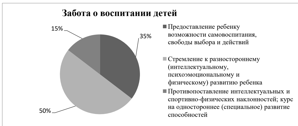
Рисунок 4 – Взгляд респондентов на воспитание детей

Из анализа на утверждение «Забота о потомстве» получается, что большинство опрошенных предусматривают рождение только одного ребенка (56%), однако 44% – отдают предпочтение большой семье.