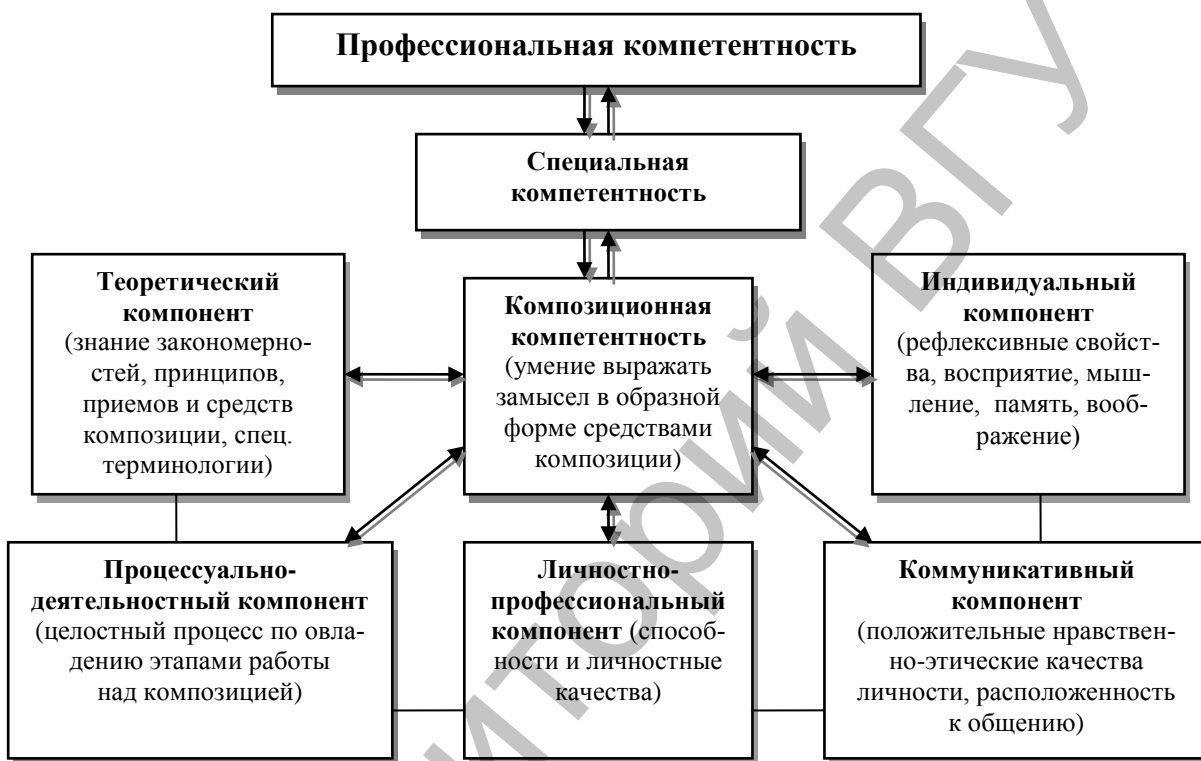
Рис. 2. Структура формирования профессиональной компетентности студентов художественных специальностей на занятиях по композиции.

Учитывая вышеуказанные предпосылки, мы вывели следующую структуру формирования профессиональной компетентности студентов художественных специальностей на занятиях по композиции (рис. 2). На наш взгляд, что профессиональная компетентность студентов художественных специальностей в области композиции складывается из следующих компонентов: теоретического, процессуально-деятельностного, коммуникативного, индивидуального и личностно-профессионального.