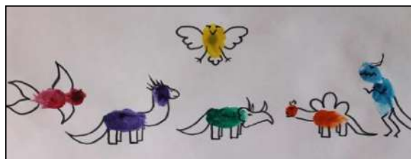
Рисунок 4. Работа «Юный исследователь»

« Юный исследователь ». На листе бумаги ребенок с помощью жидкой краски делает отпечаток пальцев и дорисовывает до какого-нибудь понятного образа. Лист можно вертеть в разные стороны, чтобы было удобнее думать. Дорисовывать можно карандашами, красками, фломастерами и др. (Рис. 4).