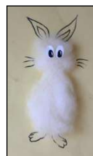
Рисунок 2–3. Работа «Заколдованный предмет»

« Юный исследователь ». На листе бумаги ребенок с помощью жидкой краски делает отпечаток пальцев и дорисовывает до какого-нибудь понятного образа. Лист можно вертеть в разные стороны, чтобы было удобнее думать. Дорисовывать можно карандашами, красками, фломастерами и др. (Рис. 4).