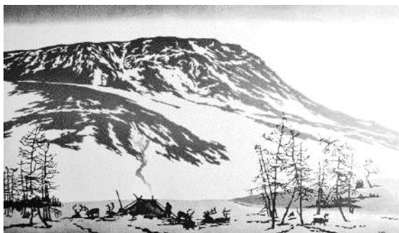
Рисунок 1. У колыбели Норильска