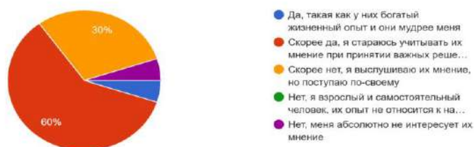
Рисунок 3 – Прислушивайтесь ли Вы к мнению представителей(ля) старшего поколения в вашей семье?

Прислушивайтесь ли Вы к мнению представителей(ля) старшего поколения в вашей семье? 60% респондентов ответили «скорее да, я стараюсь учитывать их мнение при принятии важных решений в своей жизни», 30% ответили «скорее нет, я выслушиваю их мнение, но поступаю по-своему», 5% респондентов ответили «нет, меня абсолютно не интересует их мнение» и 5% ответили «да, такой у них богатый жизненный опыт, и они мудрее меня» (рисунок 3).