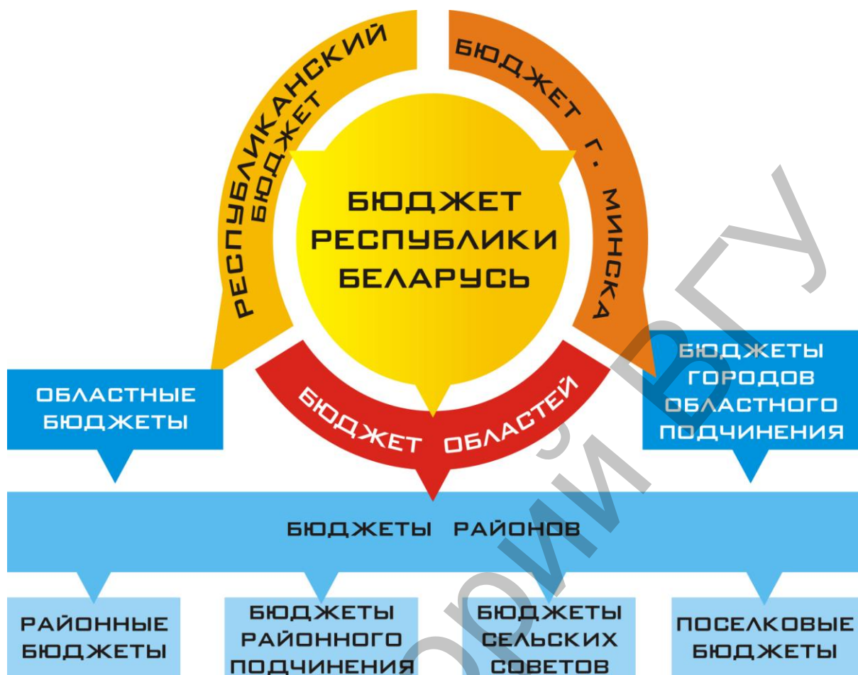
Рис. 11.1. Бюджетная система Республики Беларусь

Как формируются доходы государственного бюджета? Доходы государственного бюджета в количественном выражении представляют собой долю государства в валовом внутреннем продукте (ВВП).