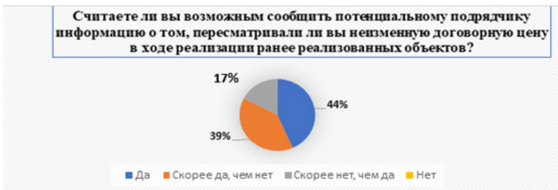
Рисунок 4 – Диаграмма результатов опроса по второму блоку вопросов «Готовность обсуждать финансовые вопросы, относящиеся к установлению твердых договорных (контрактных) цен заказчиками»