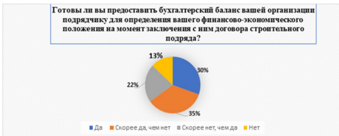
Рисунок 1 – Диаграмма результатов опроса по первому блоку вопросов «Оценка готовности предоставления бухгалтерского баланса организациями-заказчиками»

Исходя из рисунка 2, можно сказать, что 61% организаций-заказчиков готовы предоставить