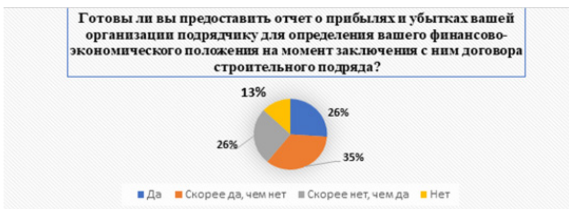
Рисунок 2 – Диаграмма результатов опроса по первому блоку вопросов «Оценка готовности предоставления отчета о прибылях и убытках организациями-заказчиками»