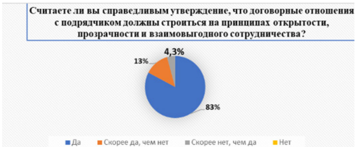
Рисунок 8 – Диаграмма результатов опроса по четвертому блоку вопросов «Вопросы, относящиеся к пониманию заказчиком того, что договорные отношения с подрядчиком должны строиться на принципах открытости, прозрачности и взаимовыгодного сотрудничества»

ском состоянии подрядчику во время либо после заключения договора строительного подряда, нефинансовых показателей деятельности, перечне построенных объектов и др.