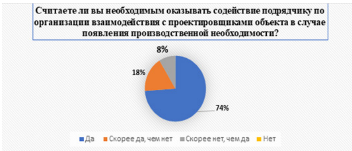
Рисунок 7 – Диаграмма результатов опроса по четвертому блоку вопросов «Готовность организации-заказчика оказывать содействие организации-подрядчику в отношении реализации работ, оказания услуг в строительстве»