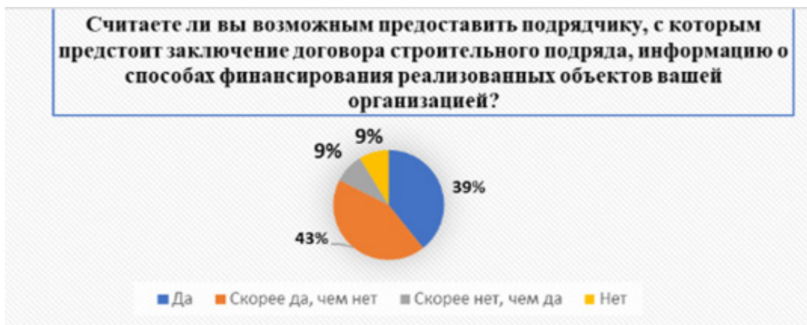
Рисунок 3 – Диаграмма результатов опроса по второму блоку вопросов «Готовность обсуждать финансовые вопросы, относящиеся к способам финансирования объектов заказчиками»

Исходя из ответов респондентов (рисунок 5), можно констатировать, что 35% из них не готовы предоставить документы о составе штата работников. Это может быть связано со сложностью формирования организационной структуры в той или иной организации либо с сокрытием того факта, что в организации числится только несколько человек, а остальные привлечены для реализации работ, оказания услуг по договору строительного подряда или выведены на аут-