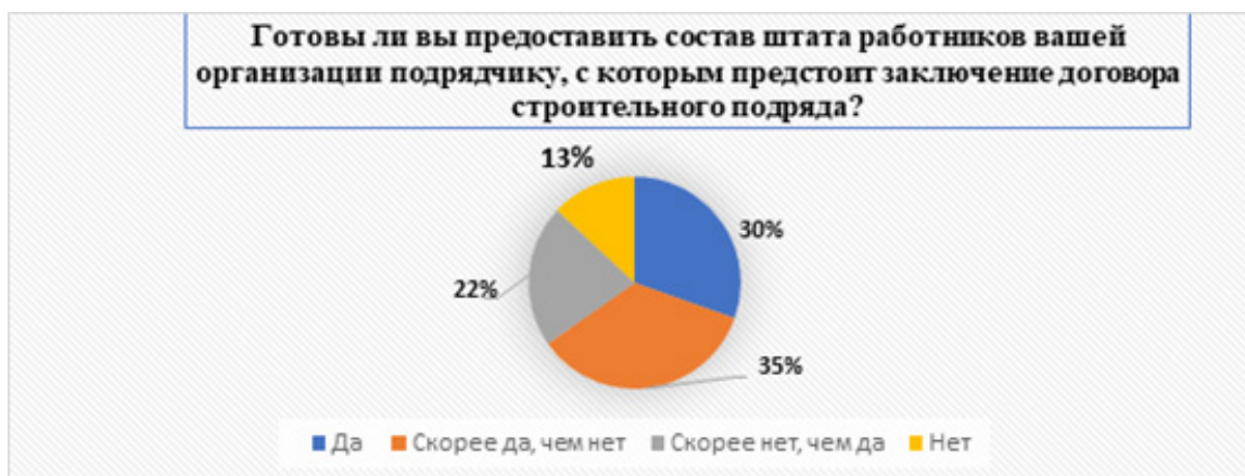
Рисунок 5 – Диаграмма результатов опроса по третьему блоку вопросов «Готовность предоставить состав штата работников организациями-заказчиками»

По результатам проведенного опроса можно сделать следующий вывод: асимметрия информации на рынке строительно-монтажных работ носит неблагоприятный характер, она приводит к возникновению ряда проблем у подрядчика: потери ликвидности и нехватки оборотных средств для осуществления деятельности, получения убытков. Инструментами решения данных проблем являются: открытое сотрудничество заказчика и подрядчика; предоставление информации заказчиком о своем финансово-экономиче-