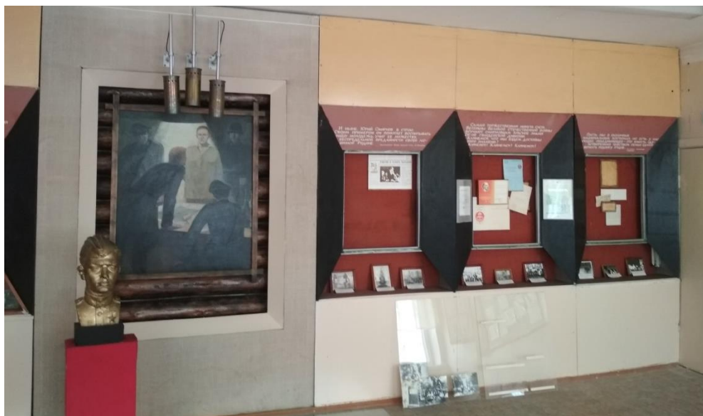
Рис 2. Экспозиция музея памяти Ю.В. Смирнова в Витебске

Заметим попутно что особую роль сегодня стали играть методы построения фигурных интерьеров во всем многообразии стилистических приемов; от разграничения на сочетание с реальной обстановкой того времени до «игры» с оформительскими приемами в стиле советского оформительского искусства 1980-х гг. Ушла фальшь на картинах того времени, изменилась методика построения всей сцены допроса. Все стало драматургически четким и обоснованным. Узнавание события стало на первый план, а документальный план на второй и в этой узловой проблеме стало заметно влияние новых веяний в оформлении интерьера музея в духе новаций Дмитрия Паштаренко, который от слов перешел к делу настолько быстро в своем проекте «Прорыв» под Кировском Ленинградской области что этот метод, не получивший еще своей оценки и критики моментально распространился по СНГ.