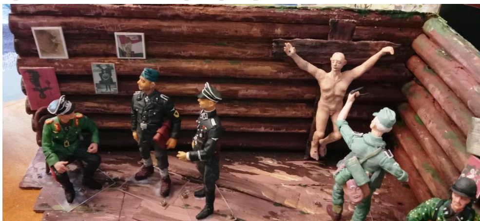
Рис 3. Макет музея Центральная часть сцены в блиндаже «Линчевание героя» Масштаб 1:15 Цветной пластик. Лепка от руки. Картон Темпера. Проект 2021 года

Заметим попутно что особую роль сегодня стали играть методы построения фигурных интерьеров во всем многообразии стилистических приемов; от разграничения на сочетание с реальной обстановкой того времени до «игры» с оформительскими приемами в стиле советского оформительского искусства 1980-х гг. Ушла фальшь на картинах того времени, изменилась методика построения всей сцены допроса. Все стало драматургически четким и обоснованным. Узнавание события стало на первый план, а документальный план на второй и в этой узловой проблеме стало заметно влияние новых веяний в оформлении интерьера музея в духе новаций Дмитрия Паштаренко, который от слов перешел к делу настолько быстро в своем проекте «Прорыв» под Кировском Ленинградской области что этот метод, не получивший еще своей оценки и критики моментально распространился по СНГ.