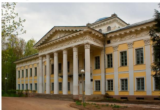
Рис.1 Главный фасад здания Жиличского дворца.

Справка: «Поселок Жиличи в Могилевской области известен с XIII века. В разные времена он принадлежал Трабским, Гаштольдам, Ходкевичам, Сапегам. «В начале XIX века имение перешло Игнатию-Казимиру Булгаку. Он полностью посвятил себя обустройству родового гнезда. В 1823 году он взял кредит, и по проекту известного архитектора Карела Подчашинского возвел большой дом с парадным портиком» [2]