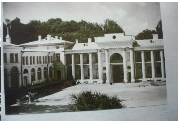
Рис.5 фото дворца времен оккупации

Новая страница существования уникального средового объекта связано с открытием его интерьеров, которые очень неплохо сохранились что нельзя сказать о Несвиже и Мирском замке. Там утраты были более весомые. И это удача для реставраторов. «В 1973 году архитектором Я. Курто был разработан проект реставрации комплекса, который в дальнейшем был реализован. В наше время во дворце расположен краеведческий музей и музыкальная школа, которые были организованы в 1996 году. Реставрация дворцово-паркового комплекса Булгаков была начата в 2009 году. После реставрации во дворце разместится музейная экспозиция, мини-гостиница и сельская библиотека. Согласно постановлению Совета Министров от 3 июня 2016 года № 437 дворцово-парковый комплекс был включён в число 27 объектов, затраты на сохранение которых могут финансироваться из республиканского бюджета. [8] вики «Летом 1877 года в Жиличах останавливался Наполеон Орда, запечатлев дворец на двух рисунках рис.»