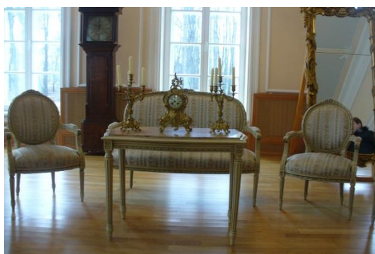
Рис. 2 Реставрации мебели в стиле ампир

Известно, что свое образование будущий хозяин дворца получил в Дерпте (Таллинн) и будучи человеком образованным и истинным патриотом принимал участие в Отечественной войне 1812 года. Был в Париже и именно там «высмотрел» все то, что потом было положено в исполнении интерьеров его залов. Стиль «Ампир» еще только входил в моду в России, и молодой офицер увидел в нем свои «грезы» как единственного стилевого элемента убранства. Из истории известно, что «Взяв в жены дочь бобруйского маршалка (местного предводителя дворянства) Юзафа Слизня Изабеллу, Булгак не только стал единственным наследником всего состояния этого шляхетского рода, но и сумел занять почетную должность своего тестя. Далее Игнатий Булгак как следует развернулся в деятельности на новом посту — занялся возрождением Бобруйска, который с 1807 года был городом не совсем обычным» [6] Даже на стадии завершения работ можно увидеть, что реставраторы всеми силами стараются как можно точнее передать дух эпохи.