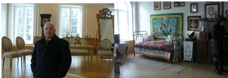
Рис 6. Фотоавтора статьи интерьера с мебелью стиля ампир. Рис 7. Фрагмент экспозиции советского периода.

«Дворец строился в два приёма: сначала был возведен главный П-образный корпус, а позже в 1864—1876 годах к нему пристроили длинное двухэтажное крыло с дворцовой церковью и дополнительными жилыми помещениями. Такое архитектурное решение образовало полуоткрытый внутренний двор. По некоторым данным, западная часть дворца была достроена в 1914 году. Первыми работами с 1825 года руководил ученик Петербургской Академии искусств Клобуковский.» [9] «Место было выбрано не случайно. Скорее всего Булгаки, помещая свое родовое гнездо в древний ландшафт, стремились подчеркнуть древность своей фамилии и преемственность традиции. Род Булгаков хоть и является очень древним, однако не стал таким влиятельным и известным как Радзивиллы или Сапеги. Поэтому в XIX веке они начали компенсировать это упущение.» [10]