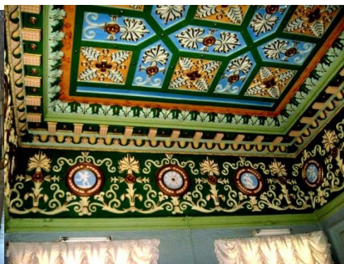
Рис.3 Фрагмент потолка одного из залов.Сложныйи эклектичный сюжет в восточном стиле.

залов.Сложныйи эклектичный сюжет в восточном стиле.