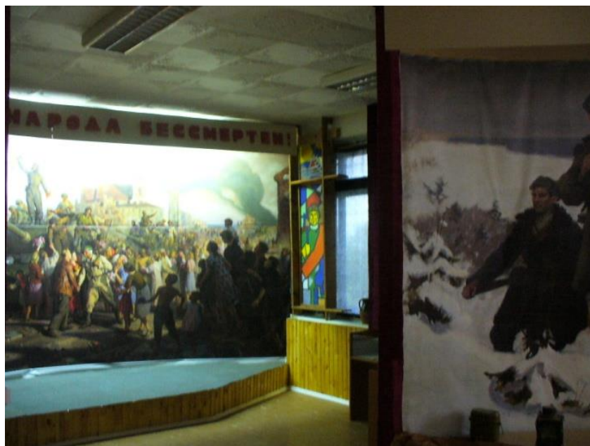
Рисунок 6. Экспозиция школьного музея г/п Клястицы. На заднем плане фото- баннер с изображением репродукции картины Зайцева «Освобождение Минска 2 июля 1944 г.» Клястицкая школа-сад им. Хомченковского Витебская область. Россонский район