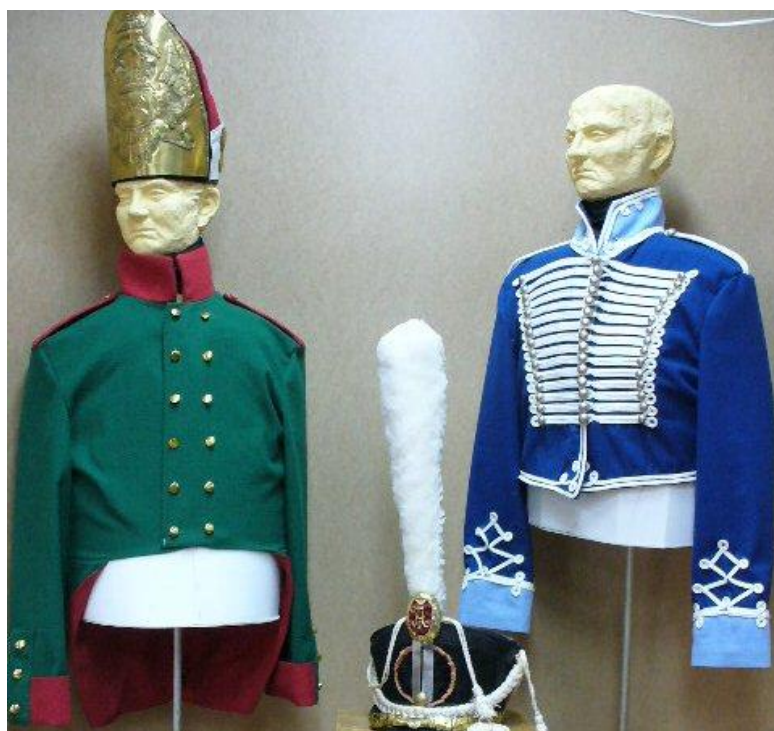
Рисунок 4. Реконструкция мундиров русских войск (авт. Горбунов, И.В.) Витебская область. Клястицкая школа-сад им Россонский район