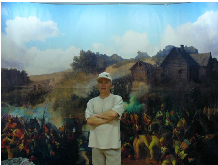
Рисунок 5. Фото -банер с изображением сражения под Клястицами в июле 1812 года, Автор экспозиции в школьном музее Горбунов И.В. Клястицкая школа-сад им. Хомченковского Витебская область. Россонский район