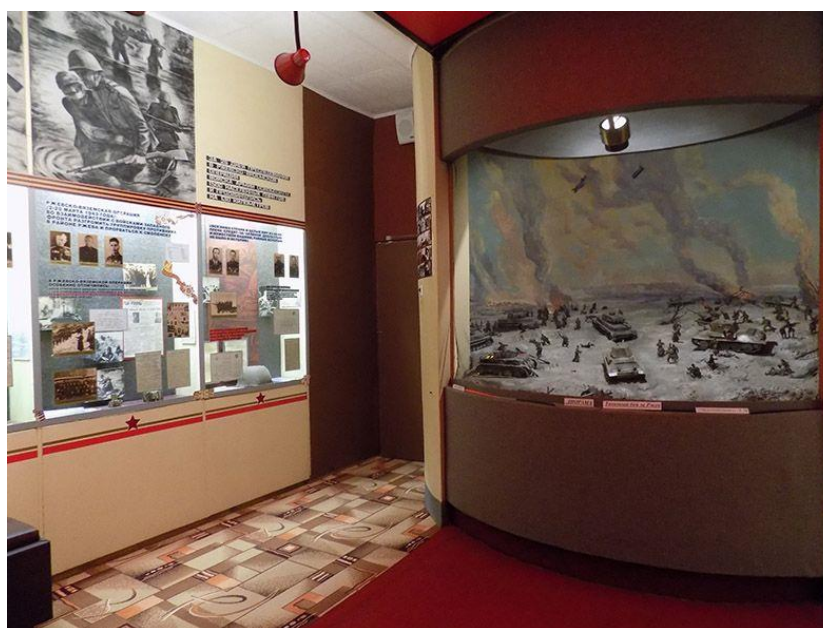
Рисунок 2. Диорама «Ржевско-Вяземская операция 1943 г: Бои на подступах к городу. Автор И.В. Горбунов, Н.Н Дундин (Модернизация экспозиции в 2015 году была выполнена Член БСХ Н.Н. Дундиным)