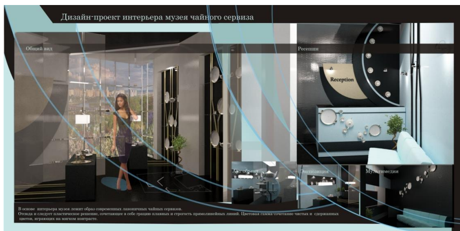
Рисунок 9. Задание на выполнение 3DMAX макета музейной экспозиции