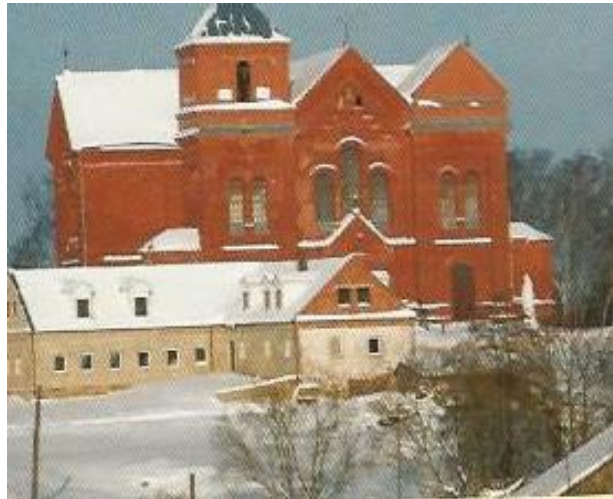
Рисунок 8. Костел в Свольно является дополнением к туристической музейной программе.