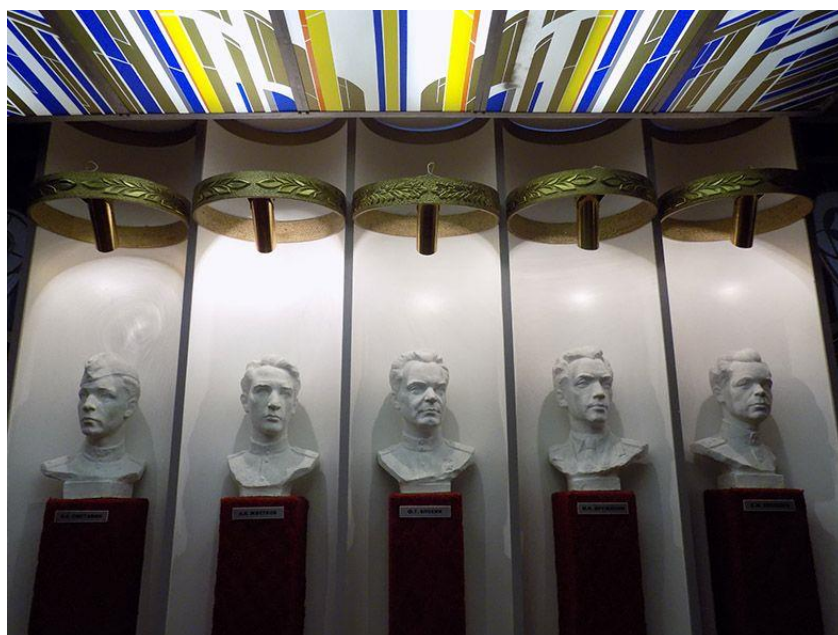
Рисунок 3. Центральная монументально-декоративная композиция с бюстами героев войны. Скульптор А. Гвоздиков. Член БСХ Витебский комбинат «Мастацтва»