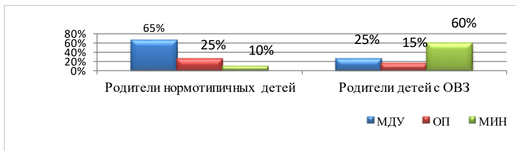
Рисунок 1. Тенденции мотивации аффилиации у родителей детей с ОВЗ и родителей нормотипичных детей, %