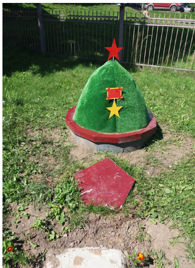
Рисунок 14 – Курган Бессмертия