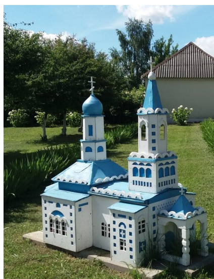
Рисунок 13 – Свято-Ильинская церковь