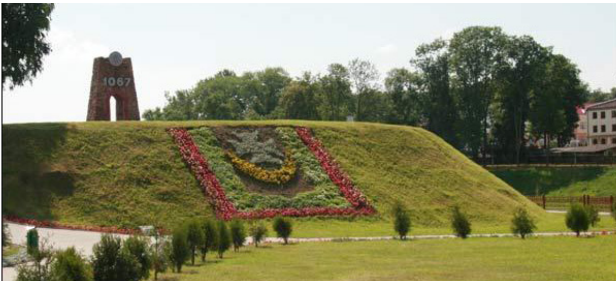
Рисунок 1 – Оршанское городище