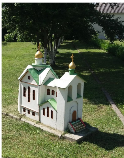
Рисунок 10 – Храм преподобного Леонида Усть-Недумского