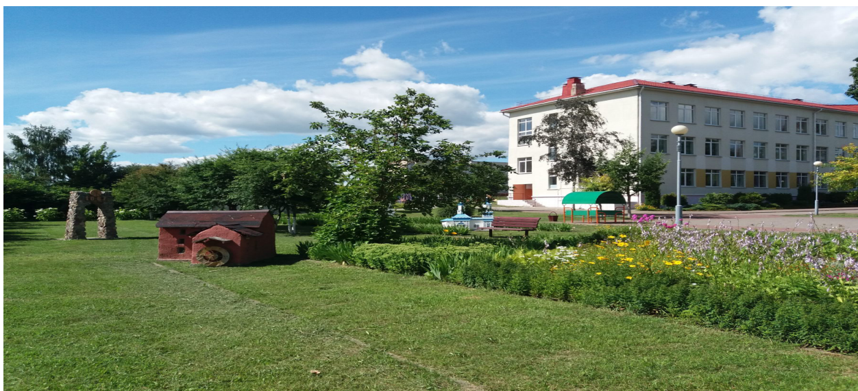
Рисунок 16 – Парк миниатюр на школьной площадке

Основная часть. Учебными программами по истории Беларуси в VI–XI классах предусмотрено изучение истории края с древнейших времен и до наших дней. Начиная с VI класса введены уроки «Наш край», таким образом местный материал стал неотъемлемой и обязательной частью при изучении истории Беларуси. Но прежде чем использовать местный исторический материал в учебном процессе, необходимо определить его место, связи и соотношение с общеисторическим материалом.