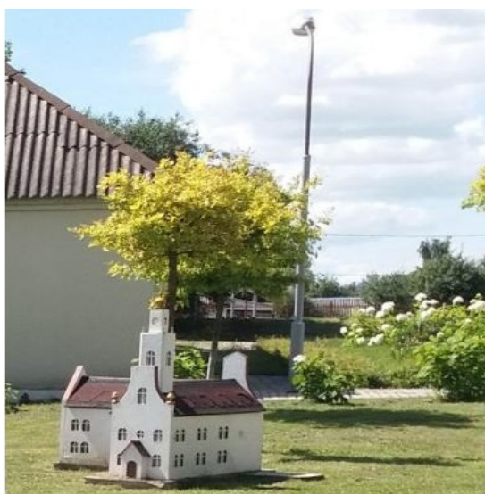
Рисунок 12 – Иезуитский коллегиум