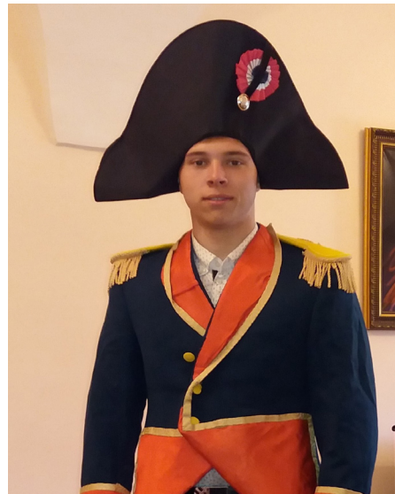
Рисунок 6 – Образ Наполеона