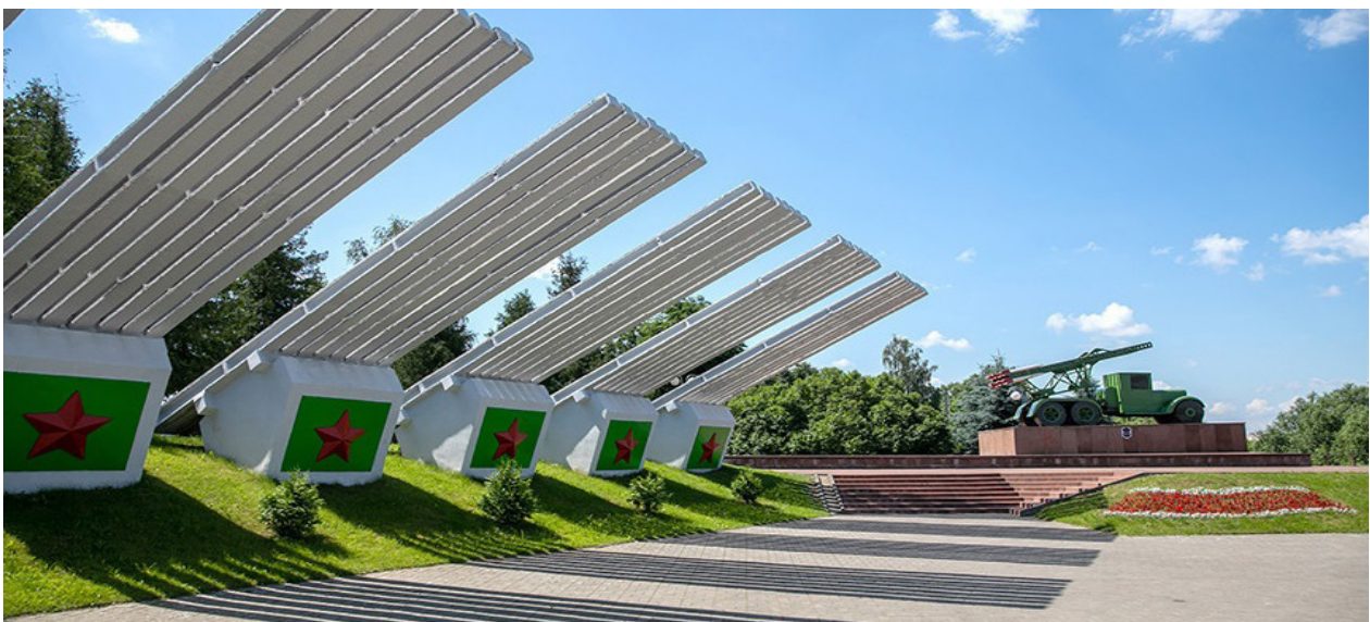
Рисунок 7 – Мемориальный комплекс «За нашу Советскую Родину» («Катюши»)