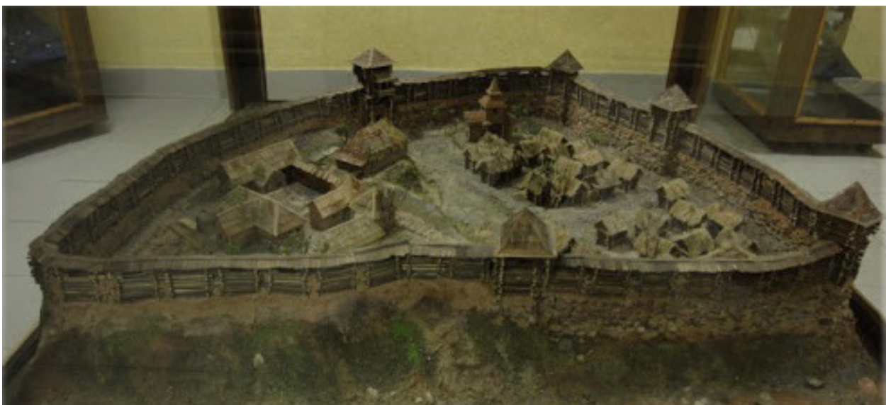
Рисунок 3 – Оршанский замок (макет)