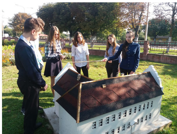
Рисунок 15 – Классный час в Парке миниатюр