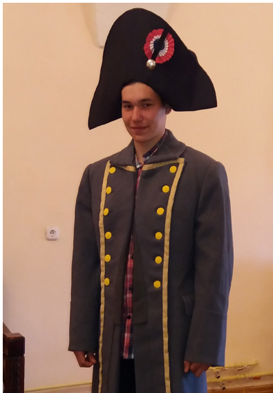
Рисунок 5 – Образ Стендаля