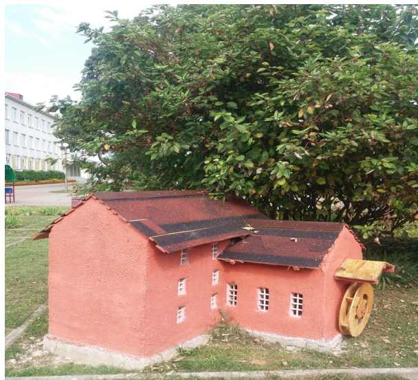
Рисунок 9 – Мельница