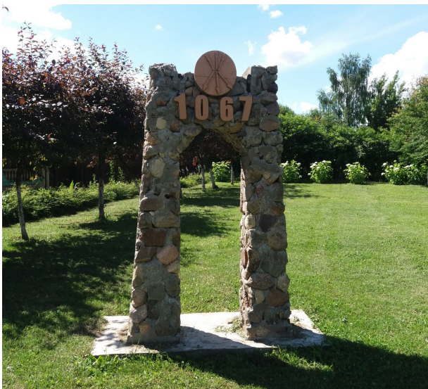
Рисунок 8 – Памятный знак на Оршанском городище