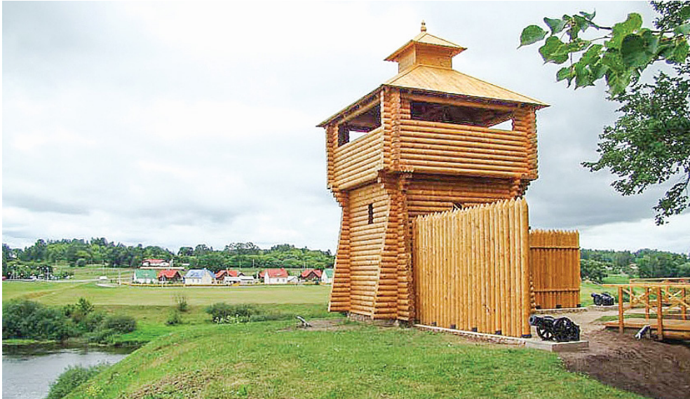
Рисунок 4 – Петровский вал в п. Копысь