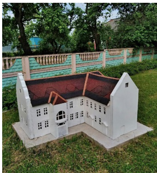
Рисунок 11 – Жилой корпус монастыря тринитариев