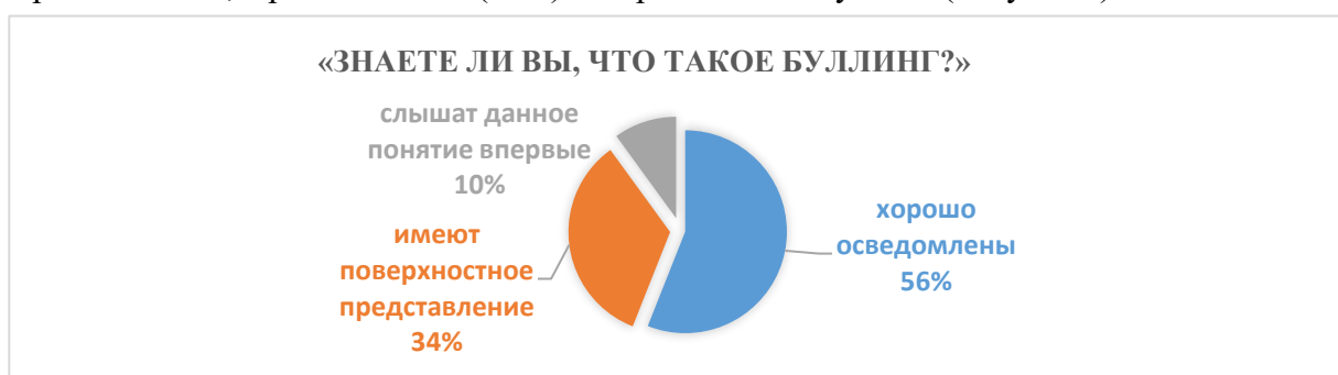
Рисунок 1 – Знаете ли Вы, что такое буллинг?

Ниже приведен анализ результатов проведенного нами исследования. Заметим, что исследование было проведено на основе анкетного листа, включавшего три блока вопросов. Первый блок был вводным. Первоначально задавался вопрос: «Знаете ли Вы, что такое буллинг?». 28 респондентов (56%) отметили, что они хорошо осведомлены о данном явлении, 17 респондентов (34%) указали, что слышали о таком, но имеют поверхностное представление, 5 респондентов (10%) – впервые об этом узнали (Рисунок 1).