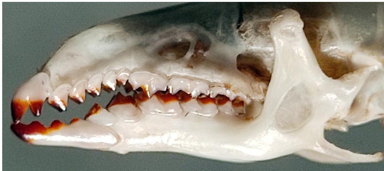
Рис. 3. Лицевой отдел черепа бурозубки равнозубой

Сравнение всего комплекса экстерьерных и краниологических особенностей пойманной особи с видовыми характеристиками [9–12] позволяет утверждать, что она относится к виду бурозубка равнозубая – Sorex isodon Turov, 1924.