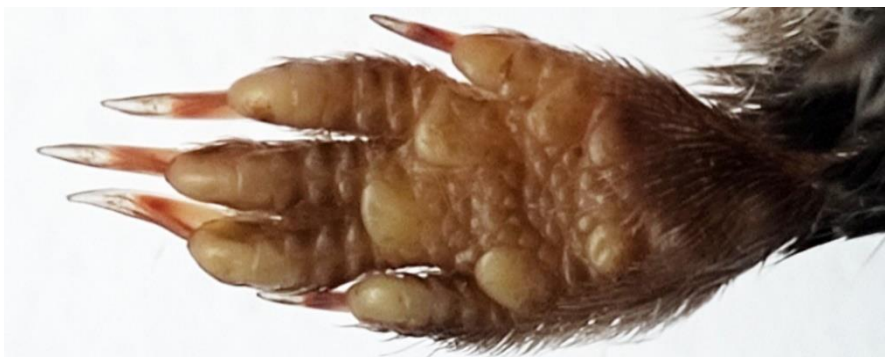
Рис. 2. Экстерьерные признаки бурозубки равнозубой

Важнейшие краниологические характеристики: кондилобазальная длина – 19,16 мм, ширина черепа – 9,91 мм, высота нижней челюсти – 4,83 мм; самый крупный промежуточный зуб – первый, высота промежуточных зубов равномерно убывает с 1-го по 5-й, пятый промежуточный зуб хорошо