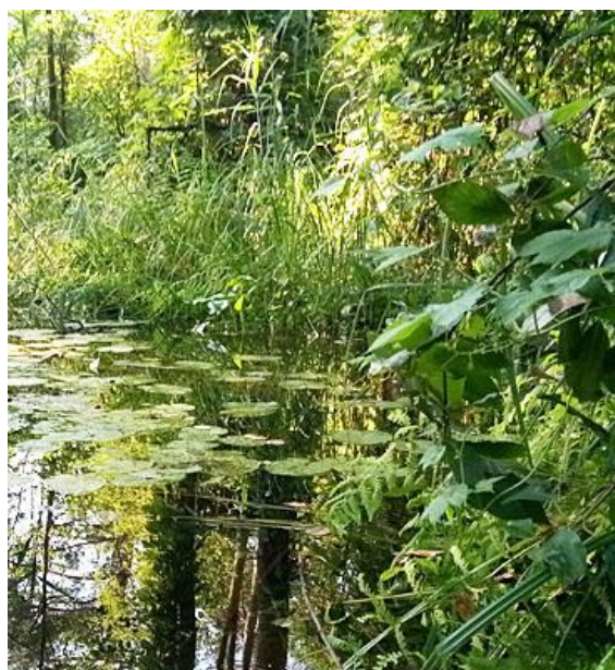
Рис. 1. Место поймки (указано) и участок местообитания бурозубки равнозубой

Они представляли из себя обрезанные ПЭТ-бутылки большого диаметра, на 2/3 заполненные водой (модифицированные ловушки Барбера). Фиксирующие жидкости в ловушки не заливали.