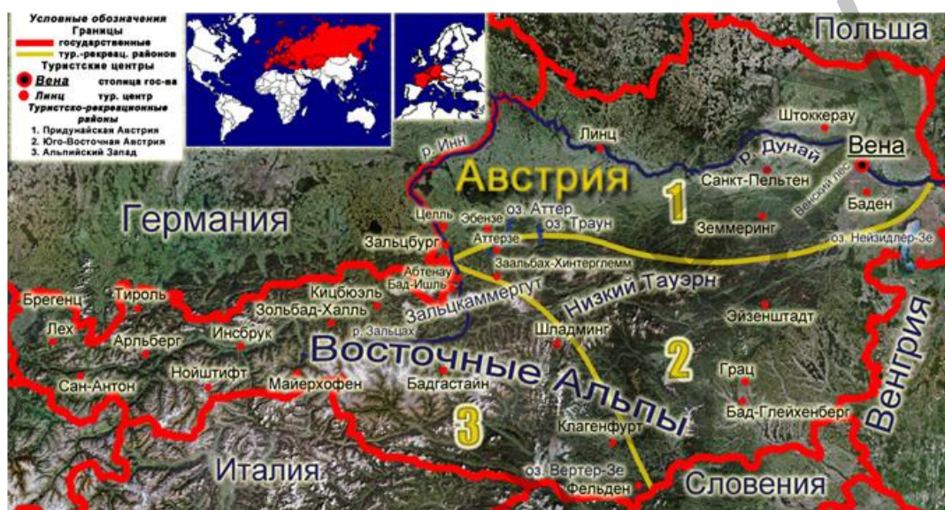
Рис. 24. Туристско-рекреационные районы Австрии

Основными туристско-рекреационными районами Австрии являются Придунайская Австрия, Юго-Восточная Австрия, Альпийский Запад. Регионы выделены в зависимости от туристской специализации каждого региона [1].