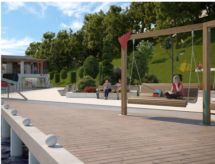
Рис. 4. Благоустройство набережной

Заключение. В результате проведенной работы можно сделать вывод, что системный и творческий подход, изучение и знание тенденций развития выбранной темы, и принципы эффективного планирования позволят создать парковую зону максимально функциональной и удобной. Также стоит отметить, что выбранная тема является актуальной для города Витебска.