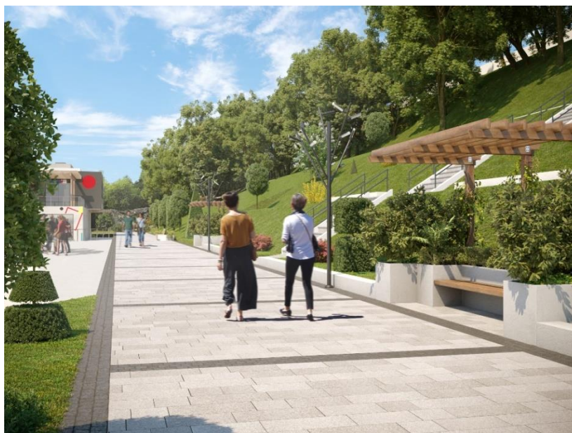
Рис. 3. Основная аллея парковой зоны

В ходе работы над экстерьером учитывались все особенности ландшафта и местности в целом. Были созданы новые зоны отдыха: побережье, арт-пространство, зона фудкорта, абстрактная аллея. Мебель создавалась согласно всем эргономическим требованиям, соответствуя лучшим качествам художественного образа заданной темы (рисунок 3 и 4).