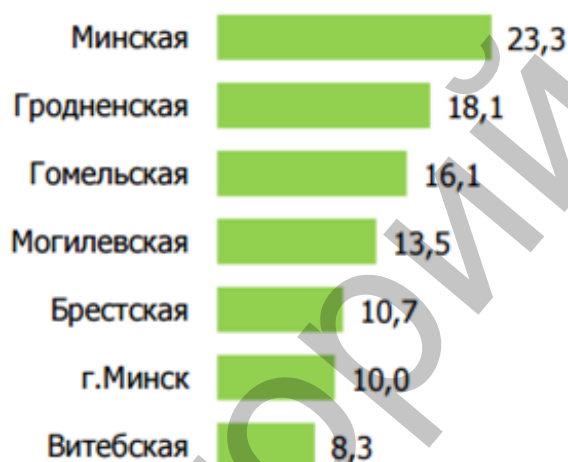
Рисунок 1 – Структура объема производства изделий из дерева и бумаги по областям Республики Беларусь