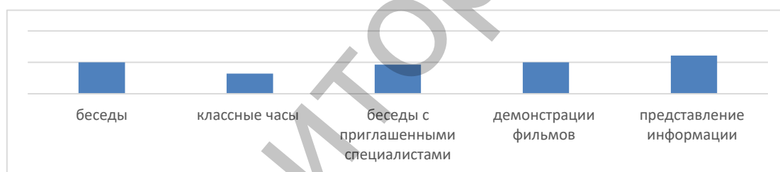
Рисунок 2 – Сведения об участии экспертов в работе по профилактике негативных явлений у учащихся.

Все эксперты (100%) ответили положительно на вопрос «Проводятся ли в Вашем учебном заведении мероприятия, направленные на предупреждение негативных явлений несовершеннолетними?», что говорит о хорошо поставленной работе коллектива в данном направлении. Среди проводимых в колледже мероприятий по предупреждению употребления алкогольных напитков, табачных и наркотических веществ несовершеннолетними опрошенные педагоги отметили следующие: беседы педагога-психолога и педагога социального, руководителей групп с учащимися – 50%, классные часы с приглашением родителей и учащихся – 32,1%, беседы с приглашенными специалистами (врачами-наркологами, представителями органов внутренних дел) для учащихся различных возрастных категорий – 46,4%, демонстрации фильмов о вреде алкогольных напитков для учащихся – 50%, представление информации для учащихся и их родителей о вреде алкогольных напитков на стендах в классных комнатах и в коридорах – 60,7% (Рисунок 2).