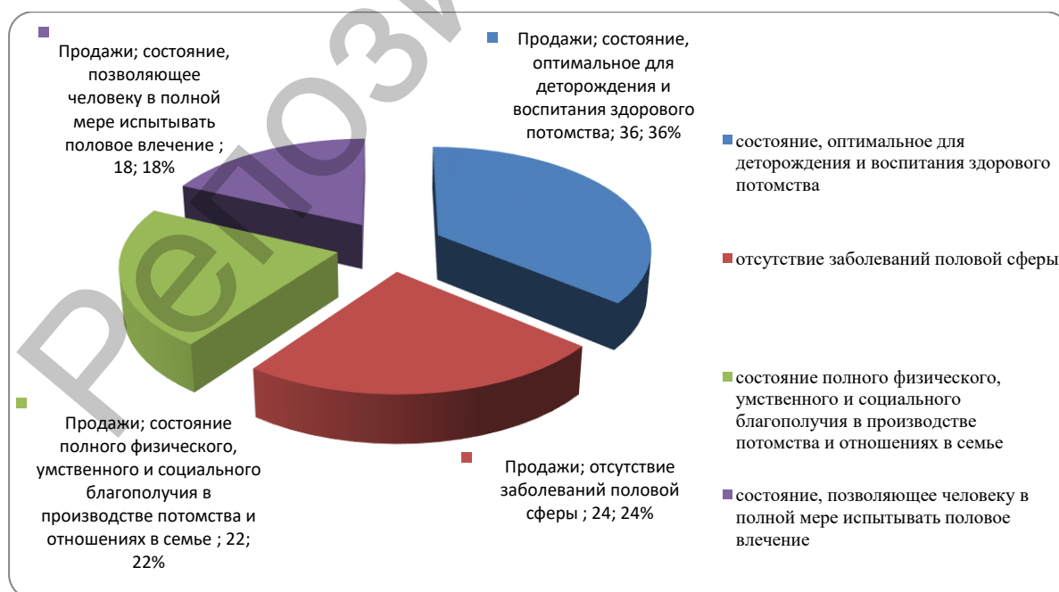
Рисунок 1 – Варианты понимания термина «репродуктивное здоровье»

1) более трети респондентов (36%) считают, что репродуктивное здоровье – это состояние, оптимальное для деторождения и воспитания здорового потомства; 24% детей-сирот полагают, что это отсутствие заболеваний половой сферы; 22% – состояние полного физического, умственного и социального благополучия в производстве потомства и отношения в семье (это верное понимание термина); 18% респондентов полагают, что это состояние, позволяющее человеку в полной мере испытывать половое влечение (рис.1). Так, более 75% респондентов достаточно узко либо ошибочно понимают термин «репродуктивное здоровье», что, по нашему мнению, связано с отсутствием у них системы знаний по данному вопросу;