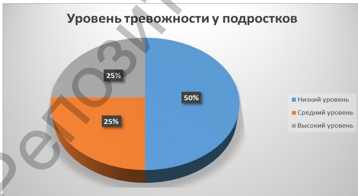
Рисунок 2 – Уровень тревожности у подростков (%)

В ходе проведения исследования личностной и ситуативной тревожности с помощью методики «Шкала личностной и ситуативной тревожности Ч.Д. Спилбергера в адаптации Ю.Л. Ханина» на той же выборке подростков получились следующие результаты, отображённые на диаграмме (рисунок 2).