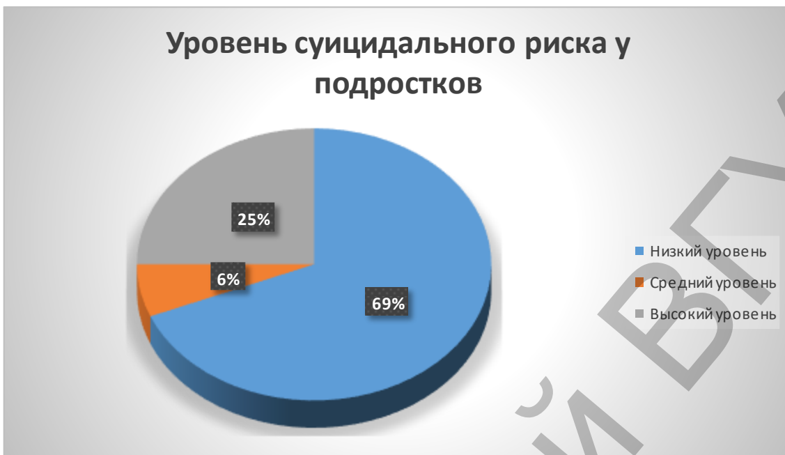
Рисунок 1 – Уровень суицидального риска у подростков (%)

Таким образом, низкий уровень суицидального риска наблюдается у 69%, средний – у 6% и высокий – у 25%. Из данных видно, что у большинства подростков (69%), принявших участие в исследованиях, низкий уровень суицидального риска.