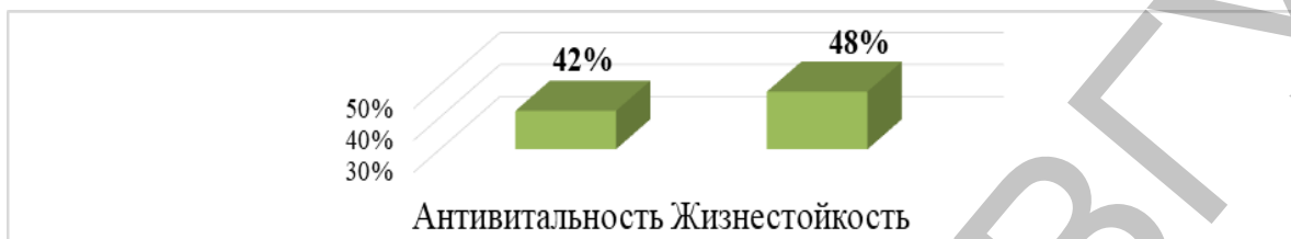
Рисунок 2 – Общее процентное соотношение антивитальности и жизнестойкости у учащихся колледжа