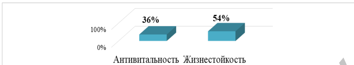
Рисунок 1 – Общее процентное соотношение антивитальности и жизнестойкости у учащихся школы