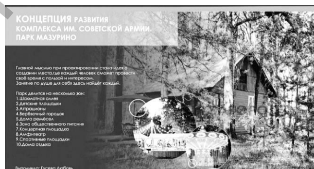
Рисунок 2 – Титульный лист альбома «Дизайн-концепция развития комплекса им. Советской Армии. Парк Мазурино»

Заключение. По итогам проделанной работы был создан альбом «Дизайн-концепция развития комплекса им. Советской Армии. Парк «Мазурино» и передан в качестве идеи преобразования парка главе Витебского областного исполнительного комитета (рис. 2).