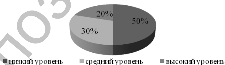
Рисунок 1 – Уровень сформированности ориентировки во времени

Низкий уровень (1-3 балла) – ребёнок дошкольного возраста может различать временные понятия, но допускать ошибки в характеристике некоторых свойств. Не устанавливает связь между игровыми, практическими действиями [1].